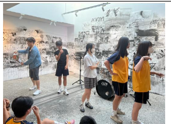
竹光國中-性教育融入攝影展