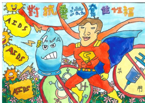
健康促進藝文競賽(性教育) 國小組 主題二 第一名