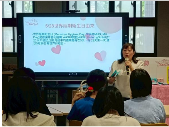
數位實中-健康促進宣導