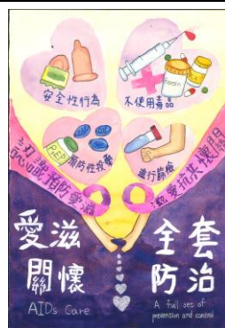
健康促進藝文競賽(性教育) 國中組 主題二 第一名