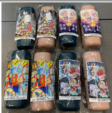
提供全市學校宣導品 其中內含藝文競賽優秀作品