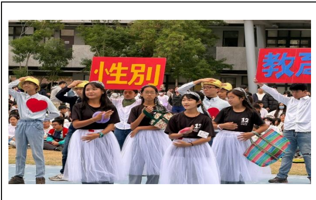
育賢國中-性教育融入創意進場