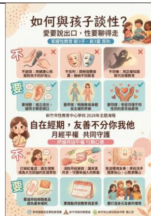
提供全市學校宣導品(海報)