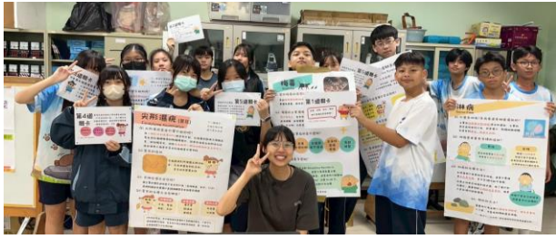
建華國中-性教育融入社團闖關活動