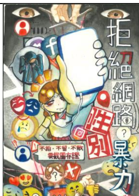
健康促進藝文競賽(性教育) 國中組 主題一 第一名