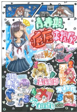
健康促進藝文競賽(性教育) 國小組 主題一 第一名