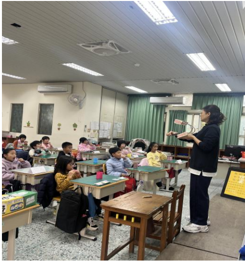
照片說明：貝氏刷牙課程教學