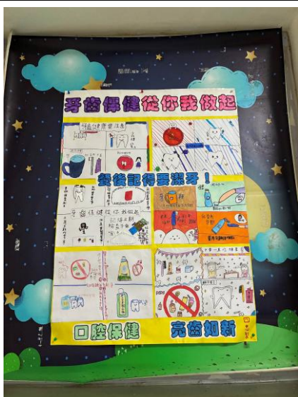
照片說明：口腔壁報專刊