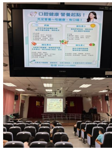
照片說明：口腔營養雙重守護宣導講座