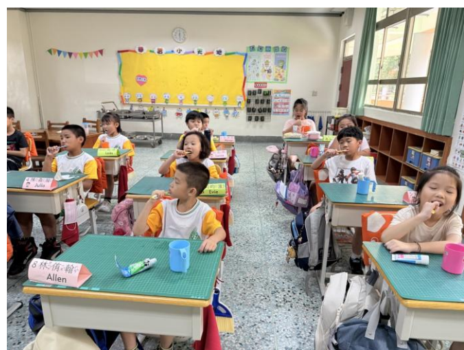
照片說明：班級靜坐潔牙