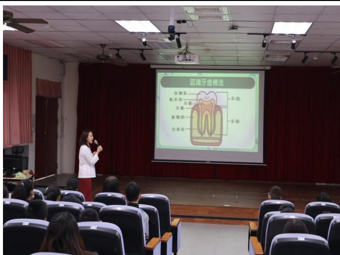
照片說明：中年級口腔保健宣導講座