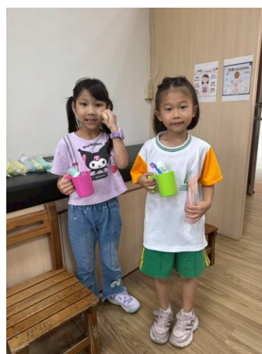
照片說明：提供牙刷牙膏組宣導品