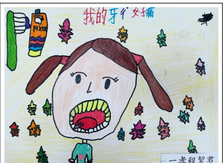
照片說明：寒假作業優良作品