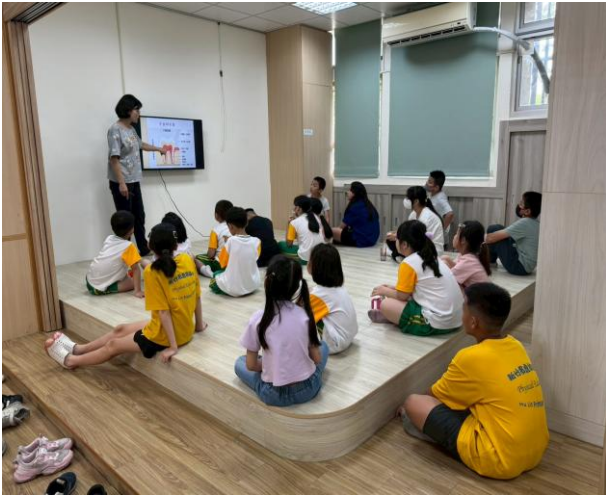
照片說明：貧困生口腔衛教課