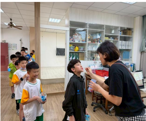
照片說明：每周抽測牙菌斑