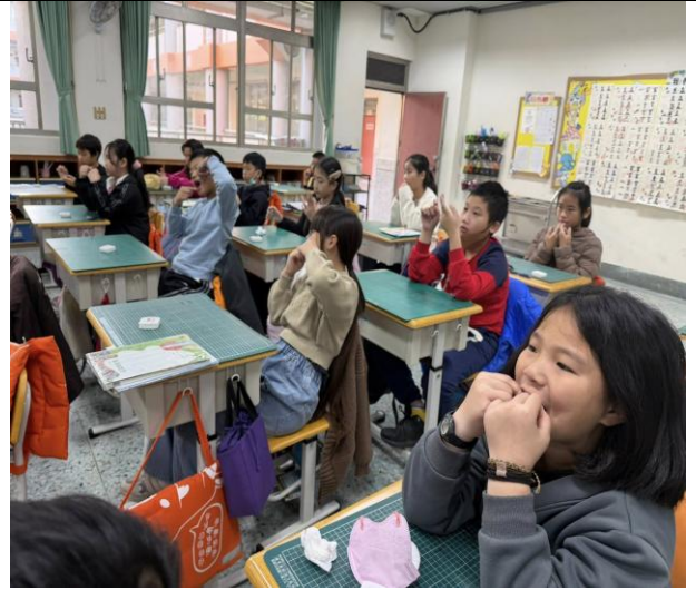
照片說明：牙線教學