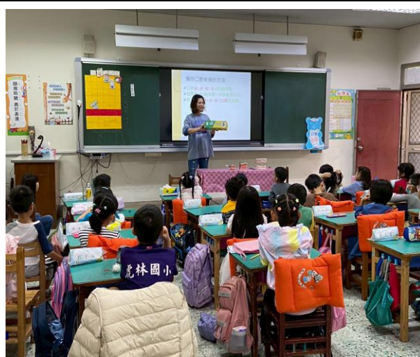
照片說明：低年級口腔宣導講座