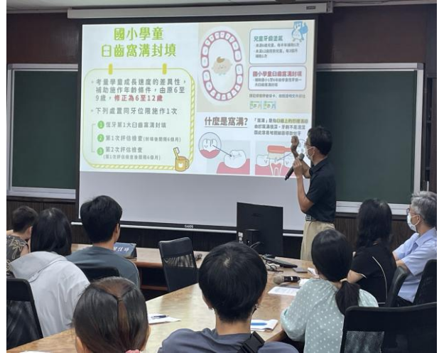
照片說明：班親會進行窩溝封填宣導