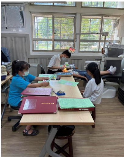
照片說明：牙齒檢查