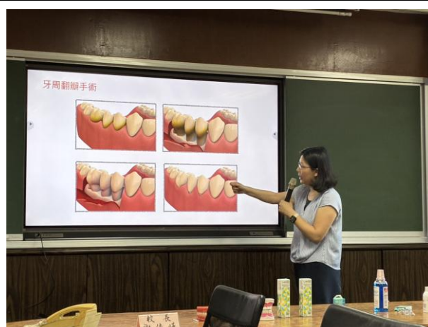
照片說明：教師口腔衛教研習