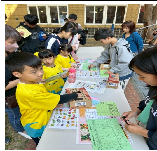
說明：校慶 85210 健康密碼闖關活動 1