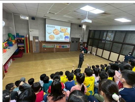
說明：二年級營養宣導