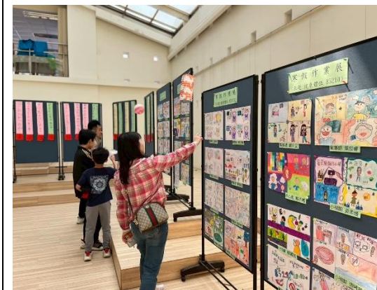
說明：寒假健康體位藝文比賽作品展