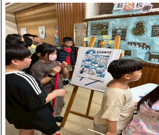
說明：兒童節上課變下課”我是健康特務”闖關活動 1