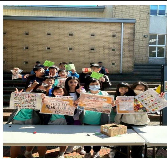
說明：校慶 85210 健康密碼闖關活動 2