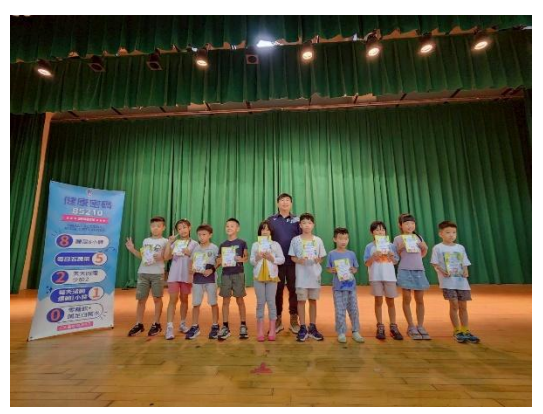
說明：各年段 85210 健康小達人表揚