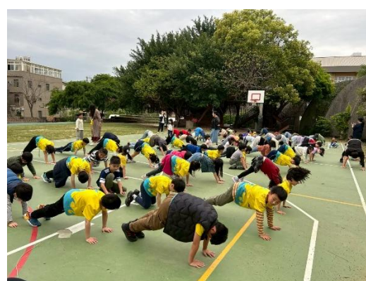
說明：二年級增肌減脂體能宣導