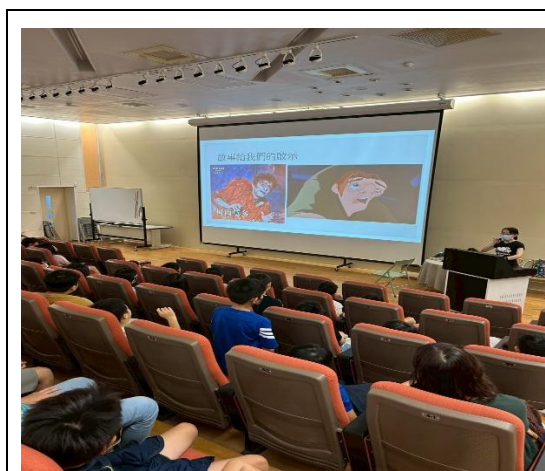
說明：四年級健康姿勢宣導講座