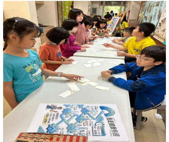
說明：兒童節上課變下課”我是健康特務”闖關活動 2