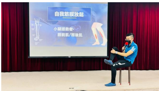
19.邀請講師宣導筋膜放鬆