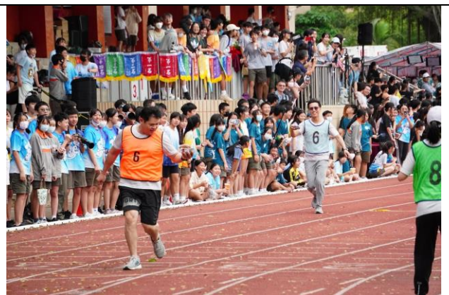
14. 家長會報名趣味大隊接力