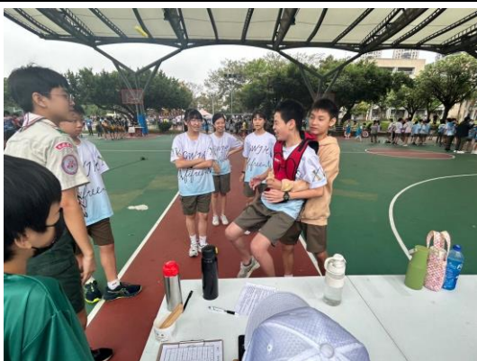
13.校慶結合健促闖關