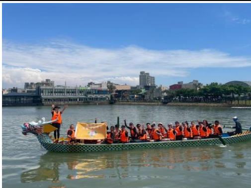
11.端午划龍舟競賽，凝聚學校健康促進共識