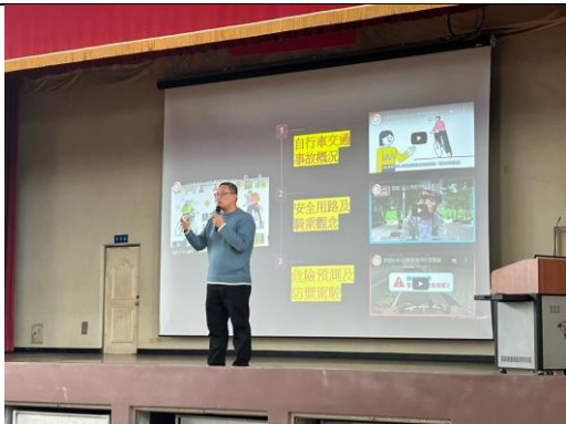
9.自行車騎乘安全宣導