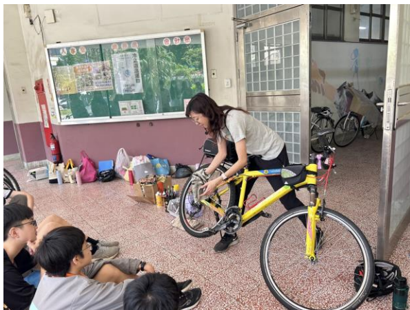
17.單車保養安全課程教學