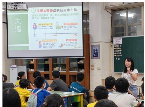
18.探索課程安全裝備教學