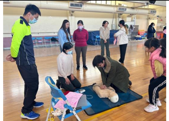
12.結合消防局進行教職員工 CPR 認證