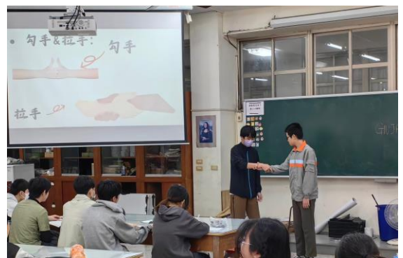
20.溯溪課程安全手勢教學