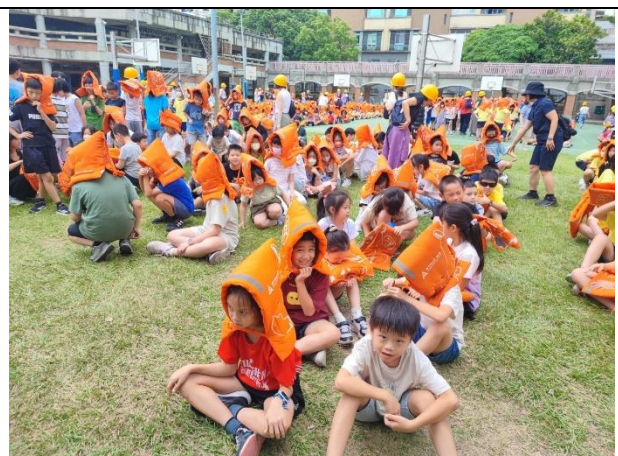
照片說明：113/09/13-全校防災觀摩演練