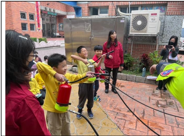
照片說明：113/12/23-四年級防護照闖關