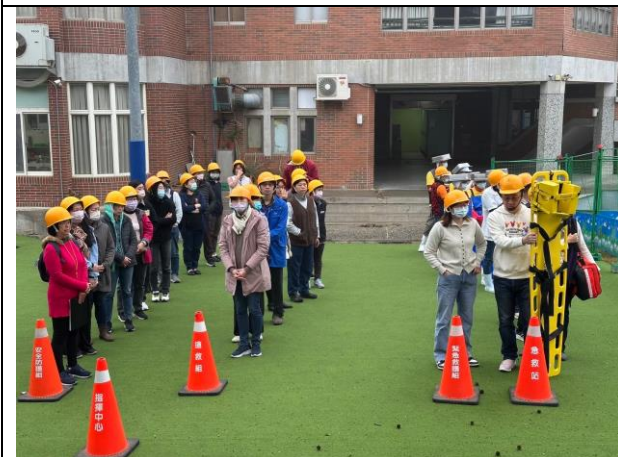
照片說明：114/02/27-全校防災演練