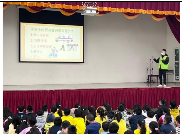
照片說明：114/01/16-中年級集會保腦教育