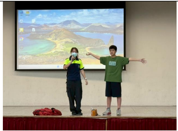
照片說明：114/06/05-中年級防溺宣導