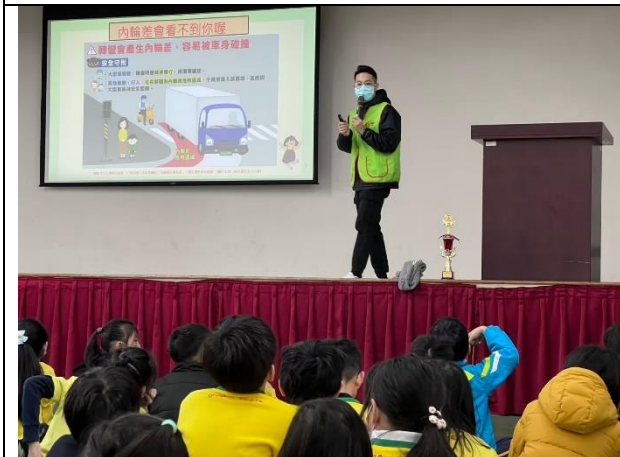
照片說明：114/01/16-中年級集會保腦教育