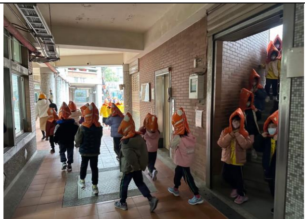
照片說明：114/02/27-全校防災演練