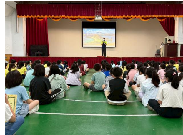
照片說明：114/06/05-中年級防溺宣導