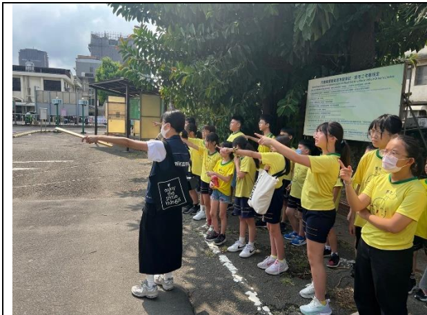
照片說明：113/09/19-道安路權公園參訪