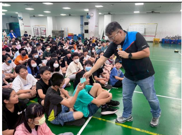
照片說明：114/05/08-自行車交通安全宣導