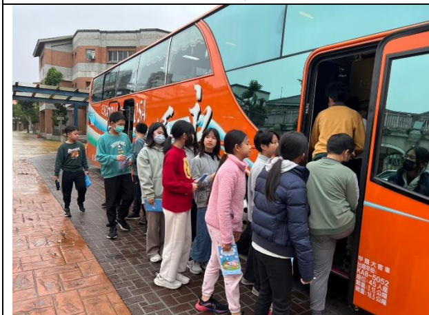
照片說明：114/02/26-畢旅行前逃生演練