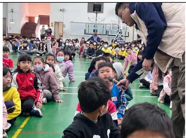
照片說明：114/01/16-中年級集會保腦教育