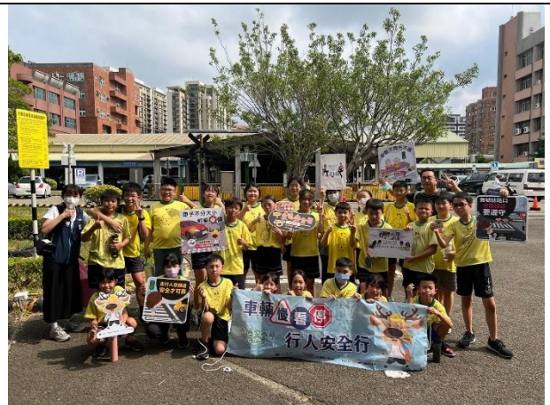
照照片說明：113/09/19-道安路權公園參訪