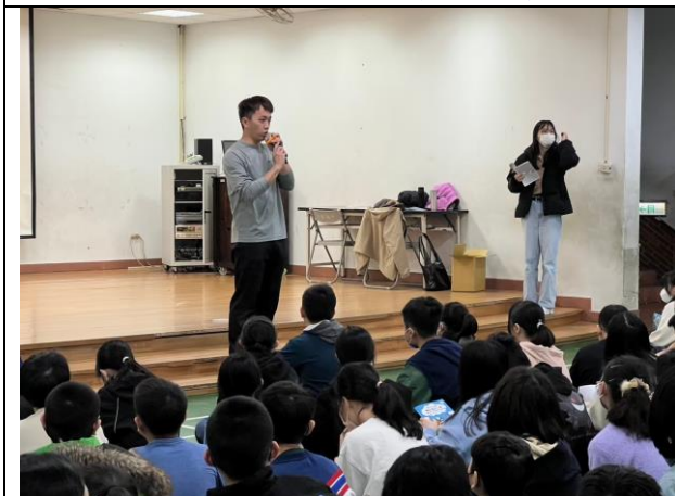
照片說明：114/02/26-畢旅行前逃生演練