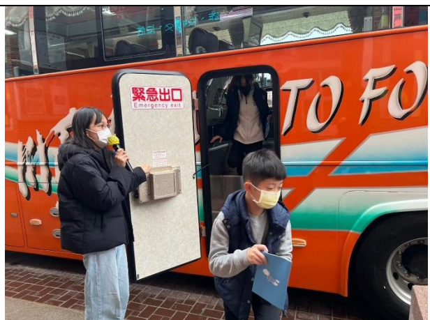
照片說明：114/02/26-畢旅行前逃生演練