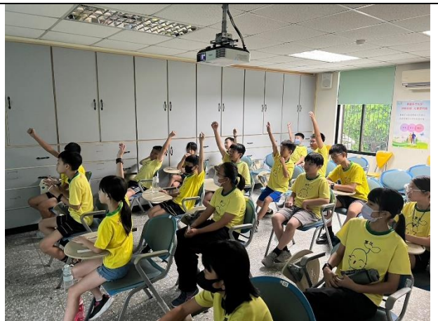
照照片說明：113/09/19-道安路權公園參訪