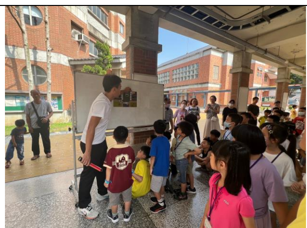
照片說明：113/08/30-小一新生闖關活動