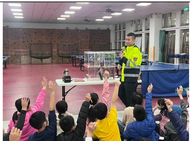
照片說明：113/12/23-四年級防護照闖關