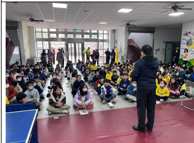
照片說明：113/12/23-四年級防護照闖關