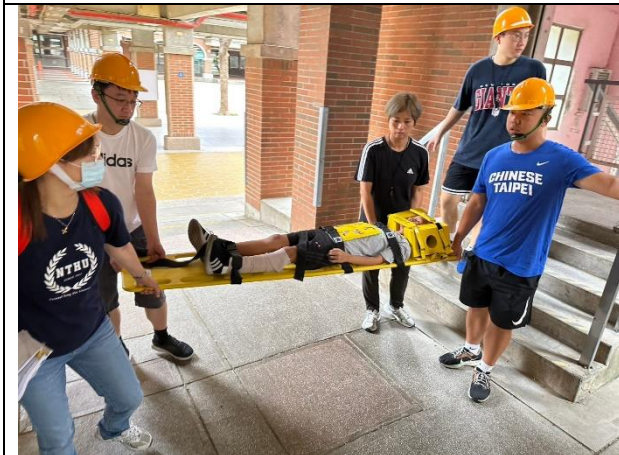
照片說明：113/09/13-全校防災觀摩演練