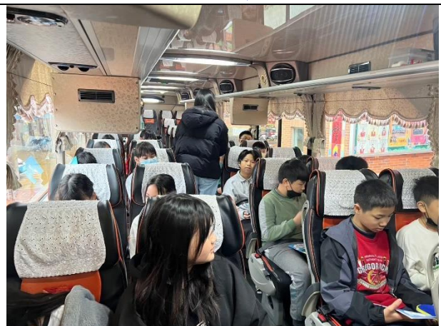
照片說明：114/02/26-畢旅行前逃生演練