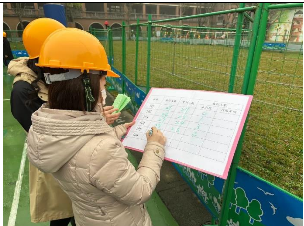
照片說明：114/02/27-全校防災演練