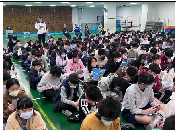
照片說明：114/02/26-畢旅行前逃生演練