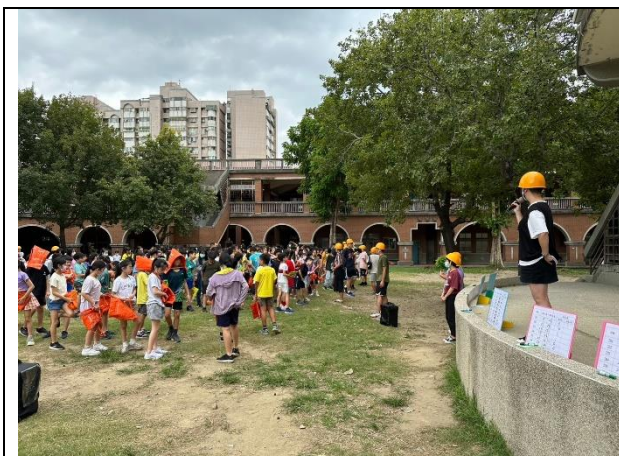
照片說明：113/09/13-全校防災觀摩演練