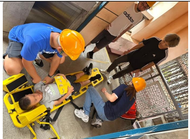
照片說明：113/09/13-全校防災觀摩演練