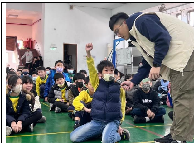
照片說明：114/01/16-中年級集會保腦教育