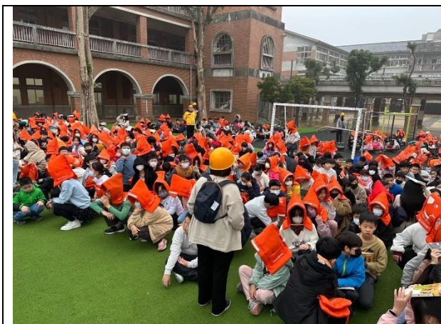
照片說明：114/02/27-全校防災演練