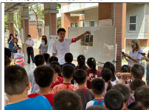
照片說明：113/08/30-小一新生闖關活動