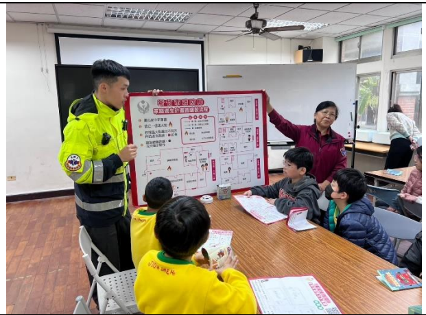
照片說明：113/12/23-四年級防護照闖關