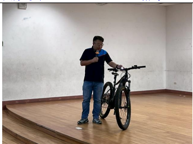
照片說明：114/05/08-自行車交通安全宣導