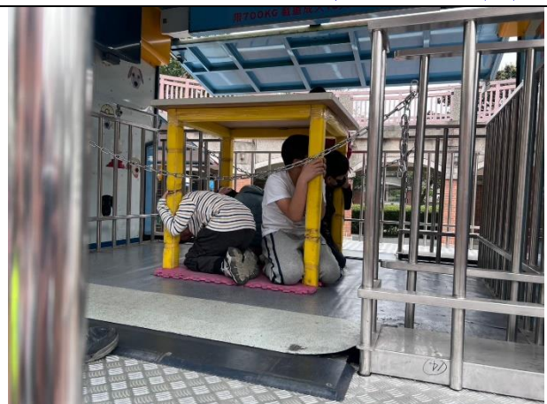
照片說明：113/12/23-四年級防護照闖關