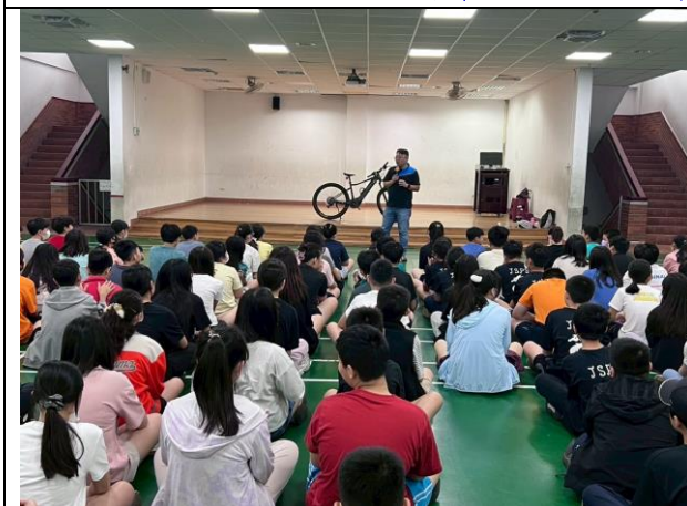
照片說明：114/05/08-自行車交通安全宣導