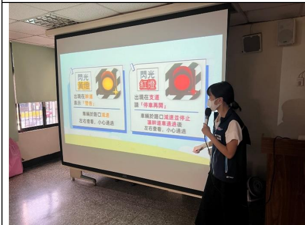
照片說明：113/09/19-道安路權公園參訪