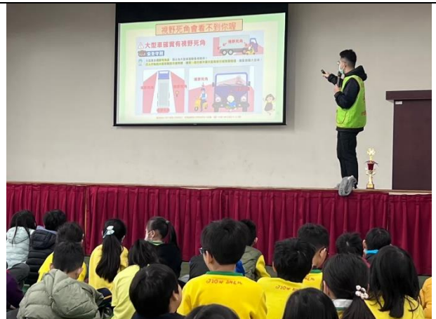
照片說明：114/01/16-中年級集會保腦教育