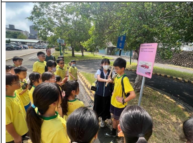
照片說明：113/09/19-道安路權公園參訪