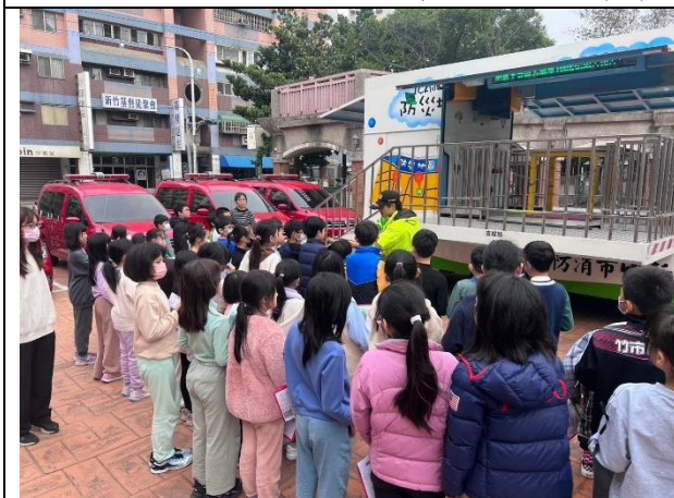
照片說明：113/12/23-四年級防護照闖關