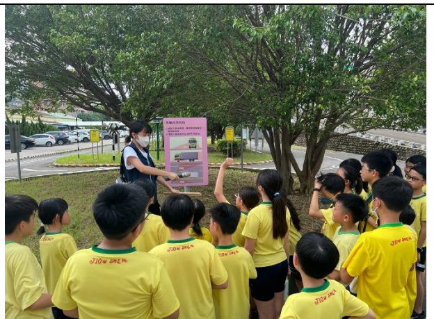
照照片說明：113/09/19-道安路權公園參訪