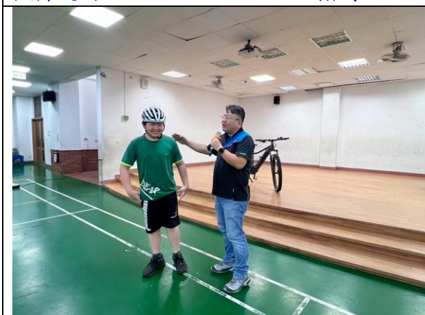
照片說明：114/05/08-自行車交通安全宣導