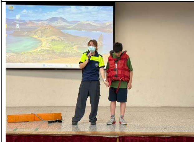
照片說明：114/06/05-中年級防溺宣導