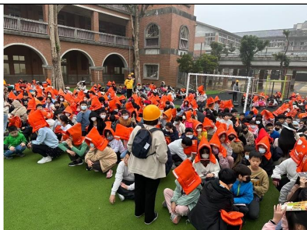
照片說明：114/02/27-全校防災演練