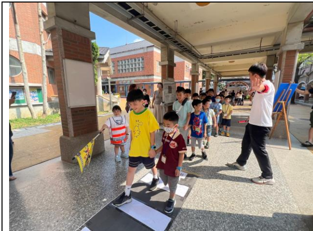
照片說明：113/08/30-小一新生闖關活動