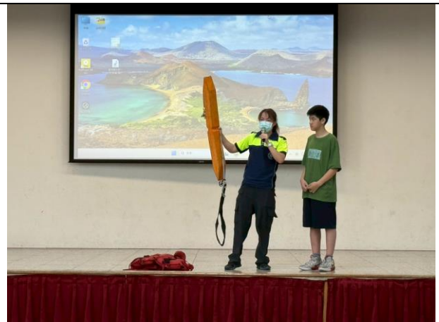
照片說明：114/06/05-中年級防溺宣導