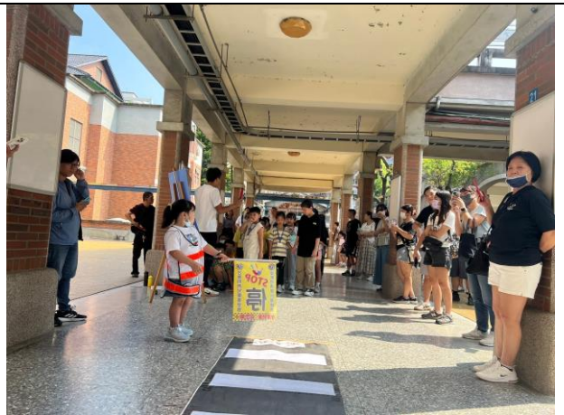
照片說明：113/08/30-小一新生闖關活動