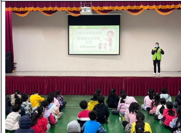
照片說明：114/01/16-中年級集會保腦教育