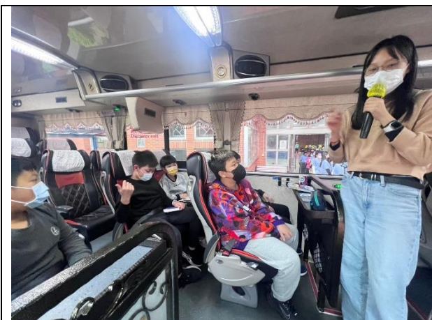
照片說明：114/02/26-畢旅行前逃生演練