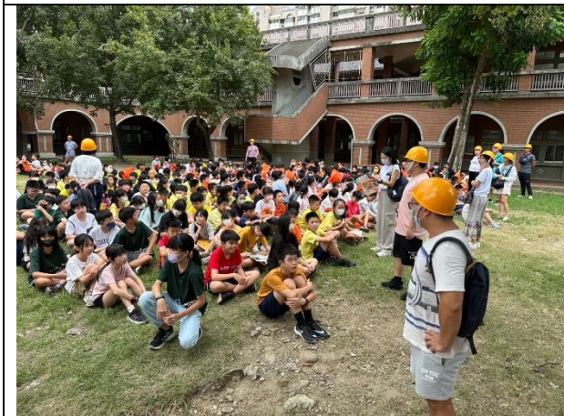
照片說明：113/09/13-全校防災觀摩演練