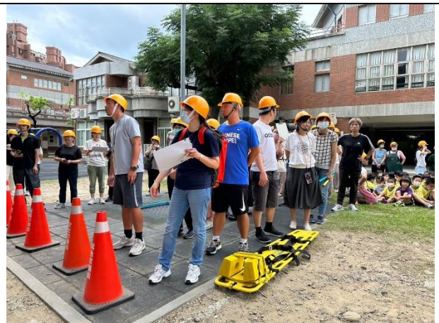
照片說明：113/09/13-全校防災觀摩演練