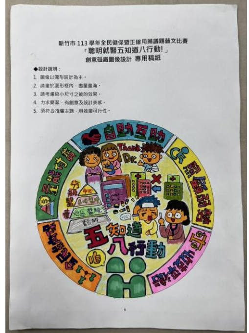
照片說明：寒假創意圖像徽章設計作品。