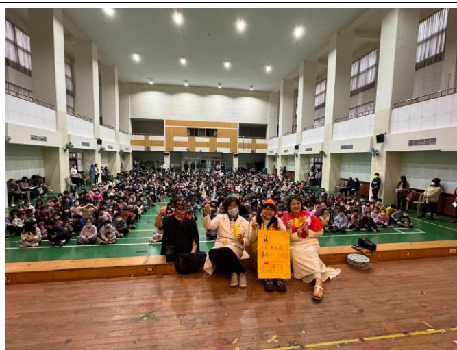
照片說明: 兒童節全民健保話劇表演。