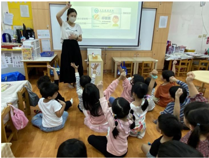
照片說明：頂埔附幼全民健保宣導。