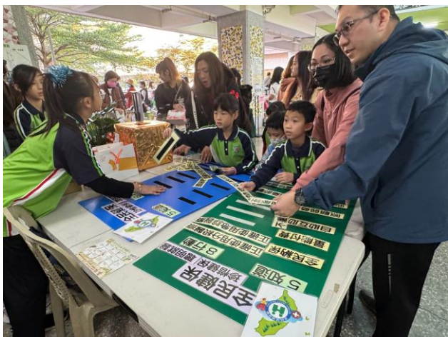
照片說明:32週年校慶全民健保議題闖關活動。