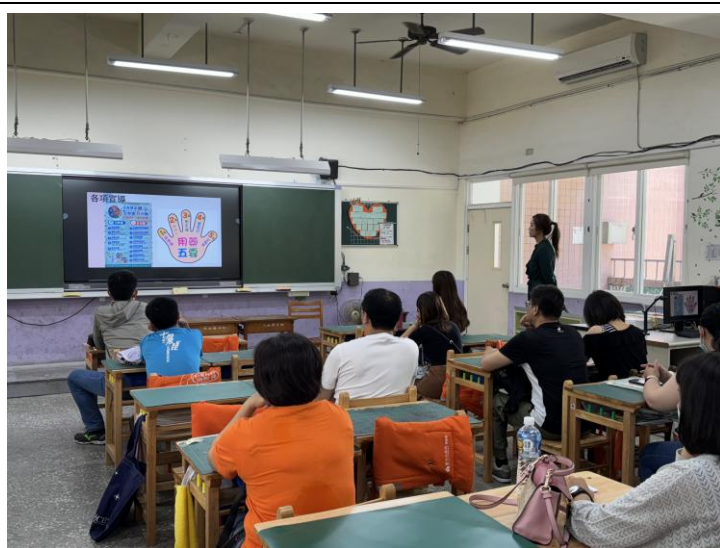
照片說明:全民健保班親會家長宣導。