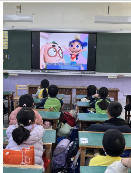
照片說明:課程影片教學-三年級學生觀看正確用藥影片。