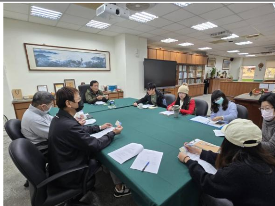
照片說明:學校衛生委員討論健促政策。