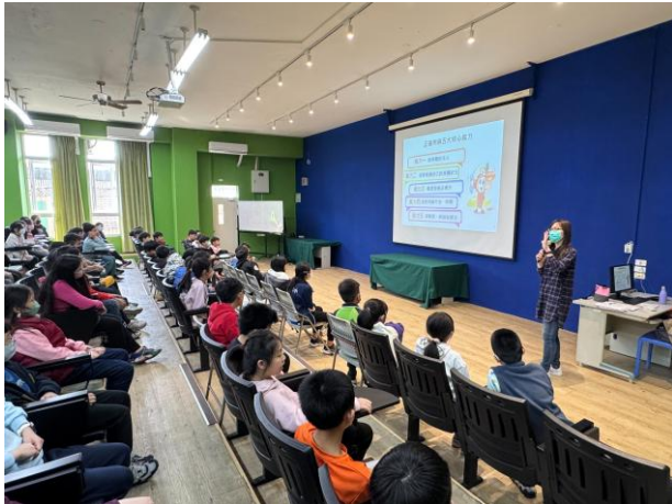
照片說明:全民健保五年級學生宣導活動。