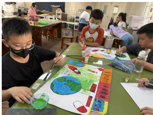
照片說明: 32週年校慶全民健保海報創作。