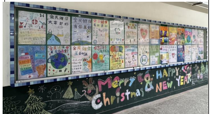
照片說明：32週年校慶全民健保宣導海報牆面布置。