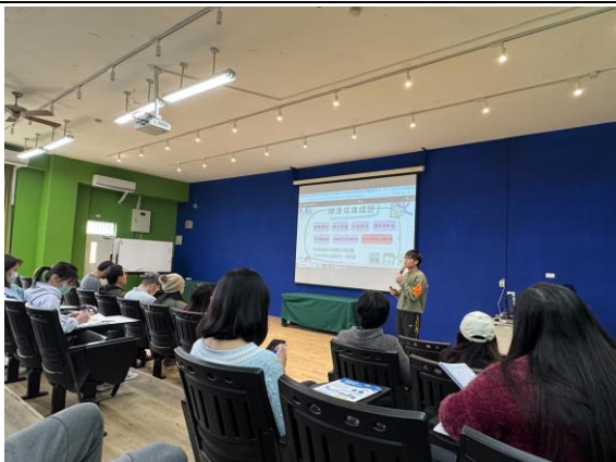
照片說明:制訂衛生政策，經校務會議通過。