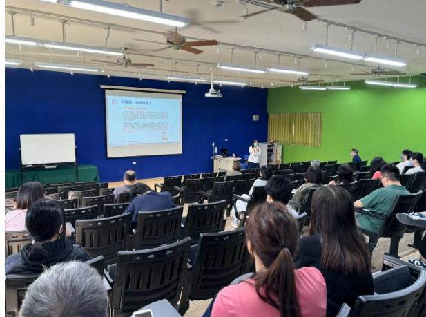
片說明:全民健保教師增能研習。