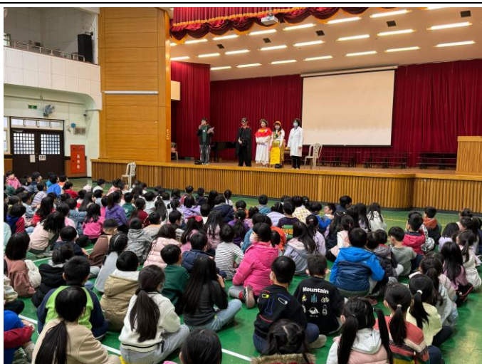
照片說明:兒童節全民健保話劇表演。