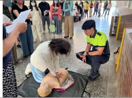
照片說明：CPR 除了知道，還會做到，每一位老師都能夠親自完成實作練習，並通過測驗。