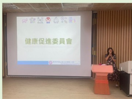
期初健康促進會議