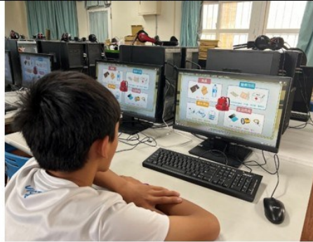
照片說明：安全教育結合各領域，讓學生更多的安全意識與知能。