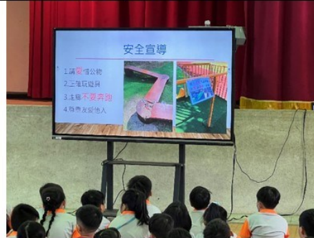
照片說明：學務處期初辦理安全教育宣導，每一位學生都要知道校園安全的重要。