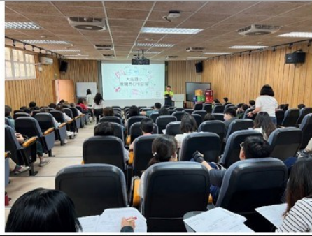
照片說明：辦理 113 學年度大庄國小 CPR 研習，講師風趣幽默，讓老師依聽就懂。