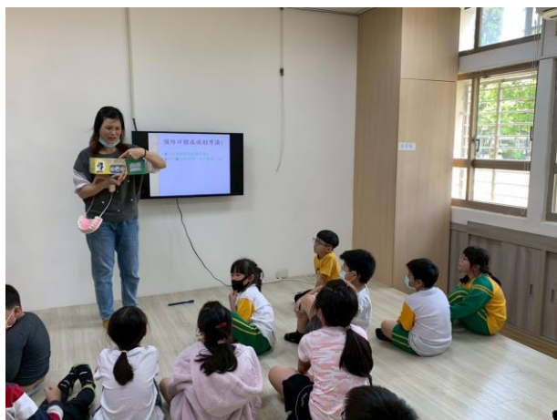
照片說明：貧困生口腔衛教課