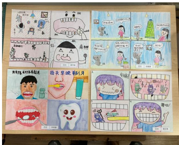
照片說明：寒假作業優勝作品