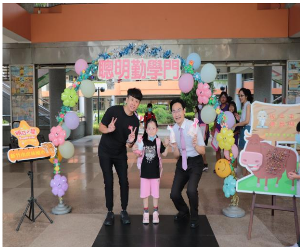
照片說明：新生入學禮—牙刷組