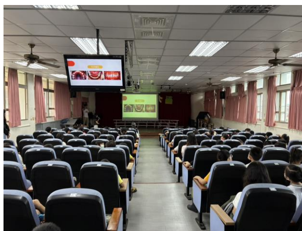
照片說明：低年級口腔宣導講座