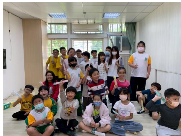
照片說明：提供貧困生潔牙組