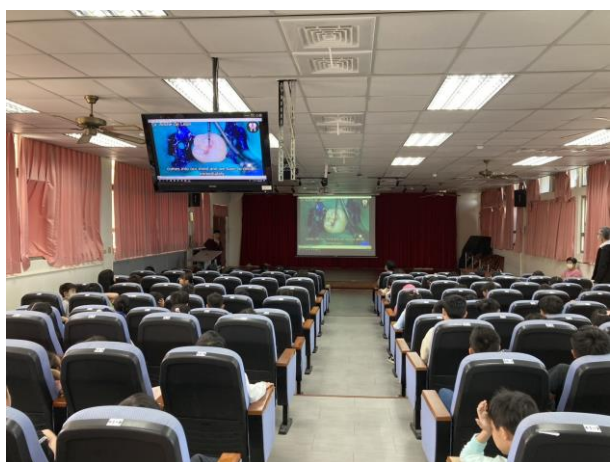
照片說明：蛀牙填補宣導講座