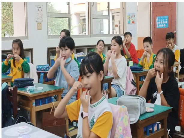
照片說明：牙線教學