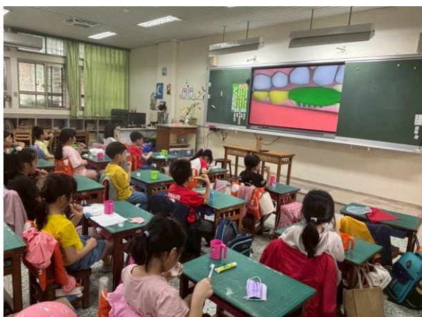
照片說明：教室靜坐潔牙