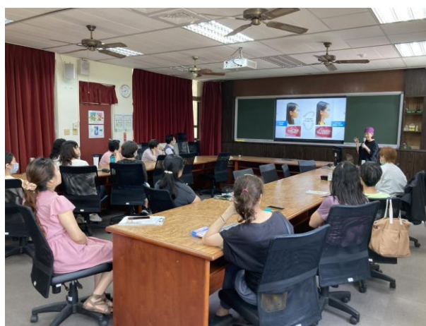
照片說明：教師口腔衛教研習