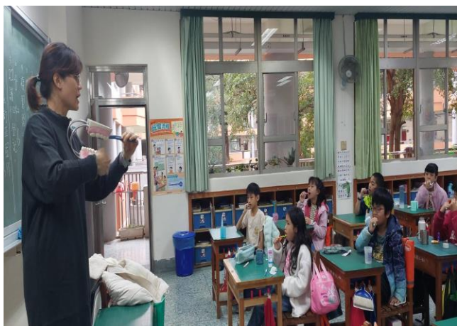
照片說明：貝氏刷牙課程教學