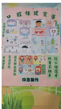
照片說明：口腔壁報專刊