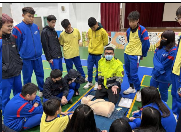
113.02.13 8 年級 CPR+AED 證照訓練