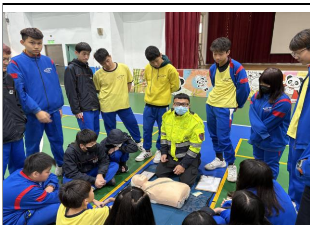
113.02.13 8 年級 CPR+AED 證照訓練