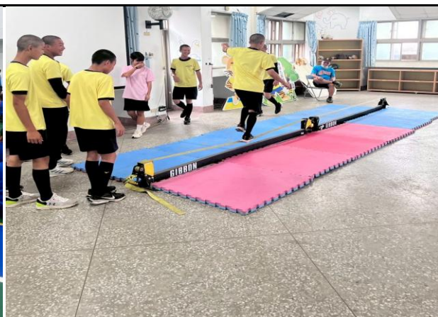
114. 5. 29安全教育盃十項全能挑戰賽