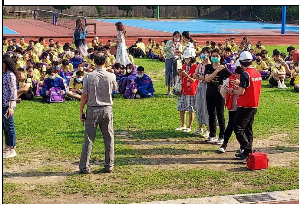
113.4.3 教室地震防災宣導