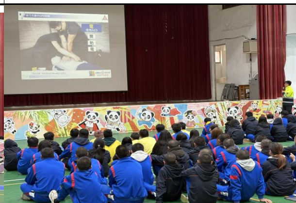
113.02.13 8 年級 CPR+AED 證照訓練