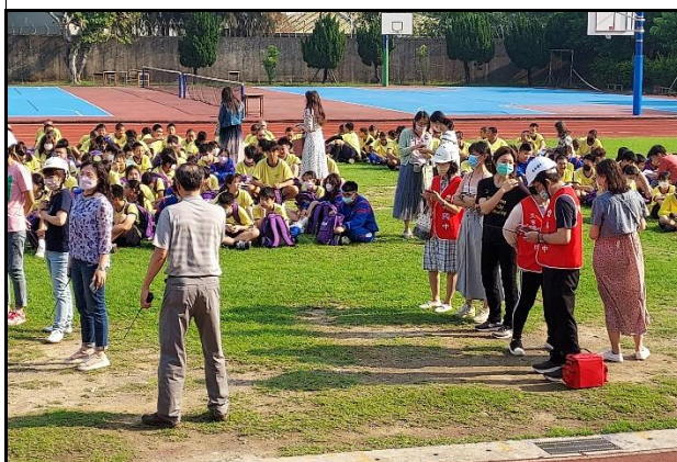
113.4.3 教室地震防災宣導