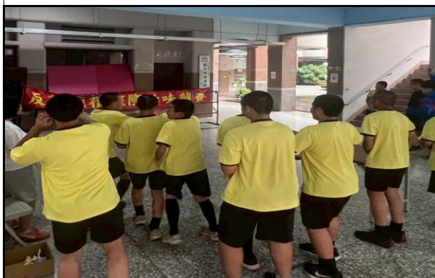
114. 5. 29安全教育盃十項全能挑戰賽