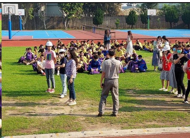
113.4.3 教室地震防災宣導