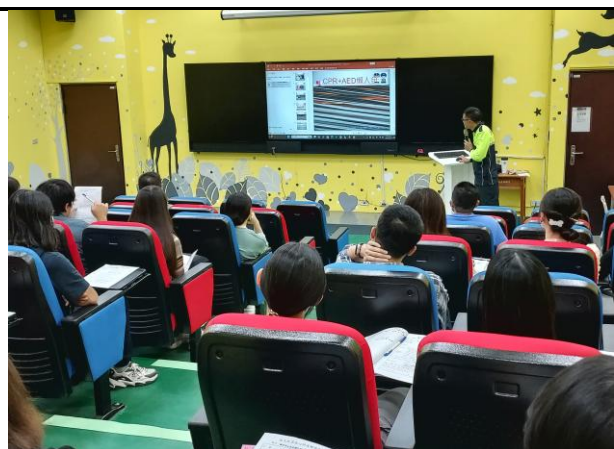
113.12.05 全校教職員工 CPR+AED 證照訓練