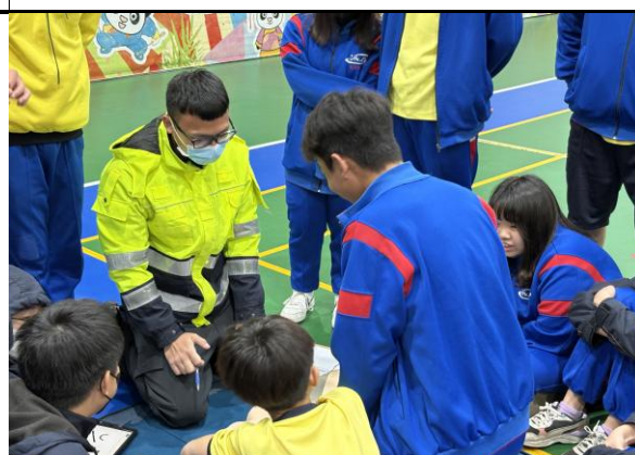
113.02.13 8 年級 CPR+AED 證照訓練