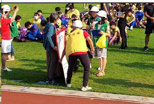
113.4.3 教室地震防災宣導