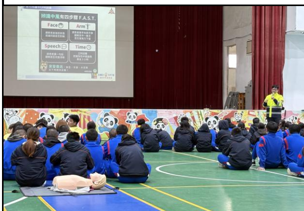
113.02.13 8 年級 CPR+AED 證照訓練