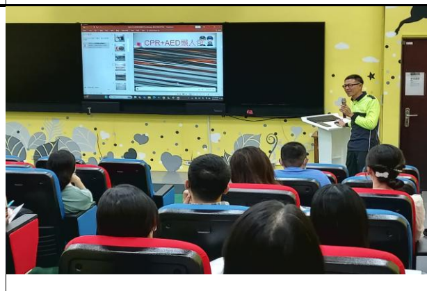
113.12.05 全校教職員工 CPR+AED 證照訓練