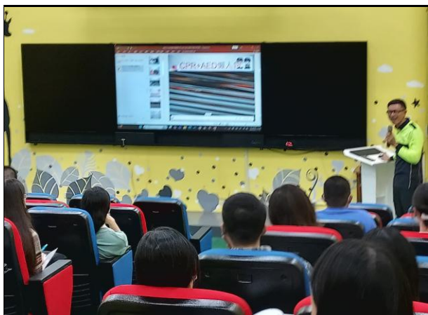
113.12.05 全校教職員工 CPR+AED 證照訓練