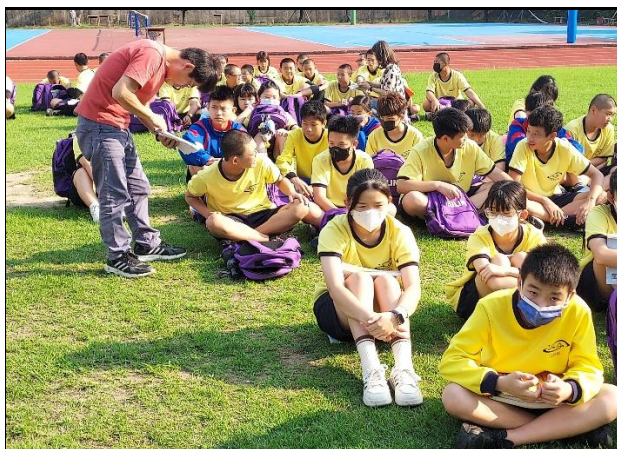
113.4.3 教室地震防災宣導