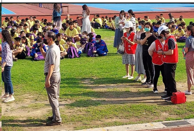
113.4.3 教室地震防災宣導