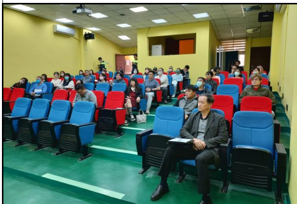
113.12.05 全校教職員工 CPR+AED 證照訓練