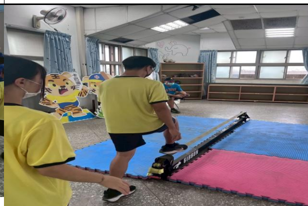
114. 5. 29安全教育盃十項全能挑戰賽