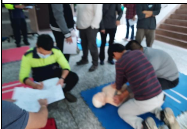
113.12.05 全校教職員工 CPR+AED 證照訓練