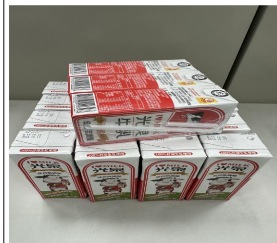
說明：提供保久乳(19 瓶/人)