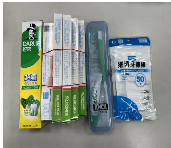
說明：提供口腔用品(高年級)