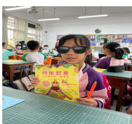
說明：提供均衡飲食教學