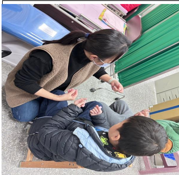
說明：提供口腔清潔教學