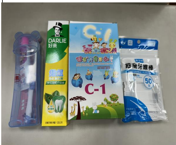
說明：提供口腔用品(中低年級)