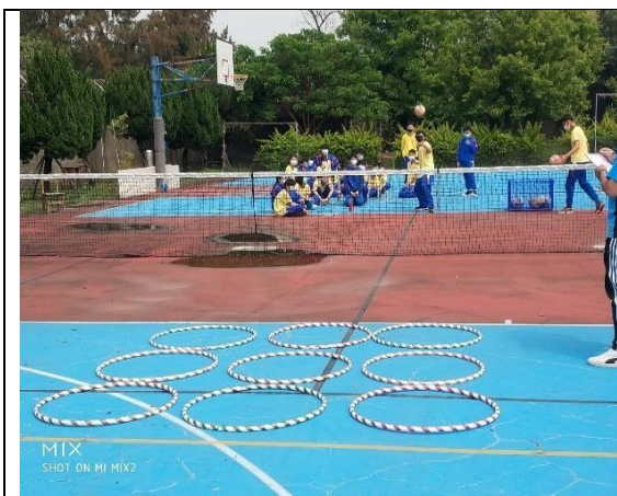
113.4.18 反菸拒檳盃十項全能挑戰賽 ~九宮格套圈圈