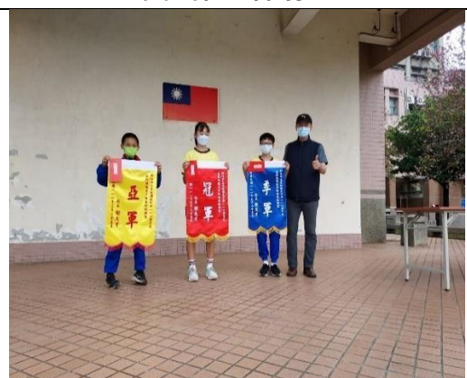
113.4.18 反菸拒檳盃十項全能挑戰賽 ~反菸拒檳盃頒獎