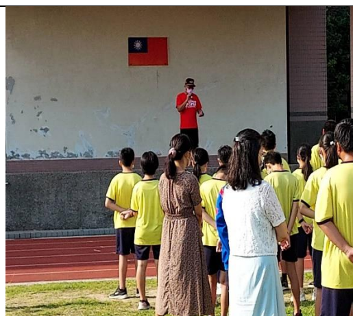
113.6.28 學期末暑假離校菸檳防制宣導