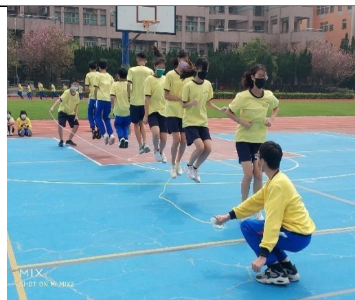
113.4.18 反菸拒檳盃十項全能挑戰賽 ~班級團體跳繩