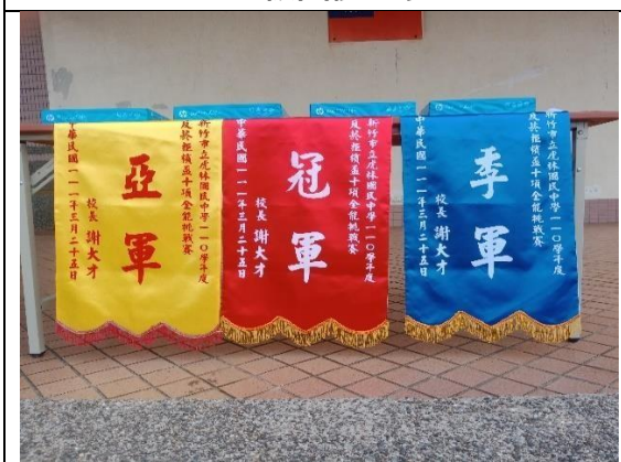
113.4.18 反菸拒檳盃十項全能挑戰賽 ~反菸拒檳盃錦旗