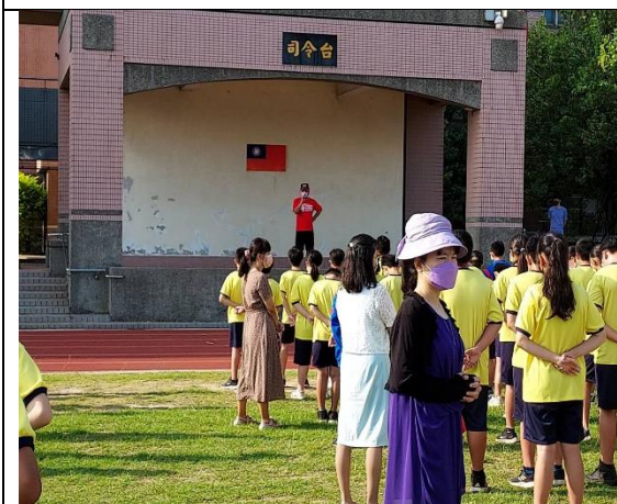
113.6.28 學期末暑假離校菸檳防制宣導