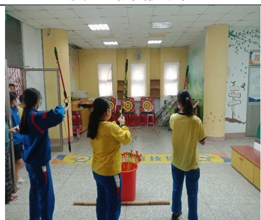
113.4.18 反菸拒檳盃十項全能挑戰賽 ~誰是神射手