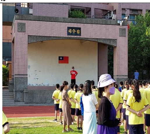
113.6.28 學期末暑假離校菸檳防制宣導