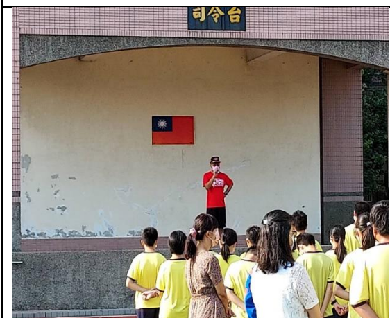
113.6.28 學期末暑假離校菸檳防制宣導