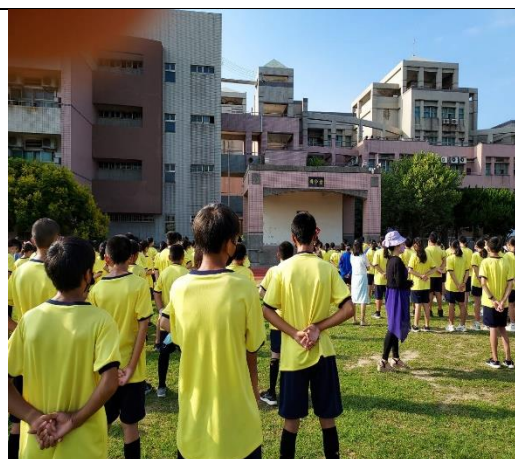
113.6.28 學期末暑假離校菸檳防制宣導