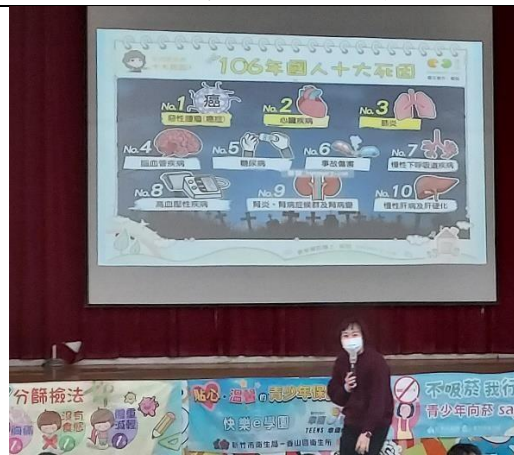
113.2.22 香山衛生所菸檳防制宣導 ~國人十大死因