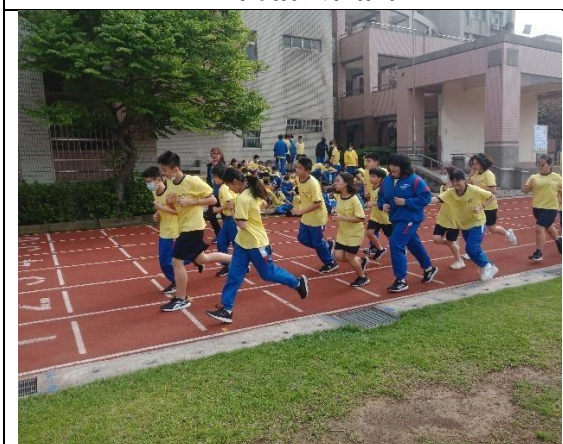
113.4.18 反菸拒檳盃十項全能挑戰賽 ~班級團體跑步