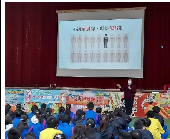
113.2.22 香山衛生所菸檳防制宣導~ 從滅菸做起