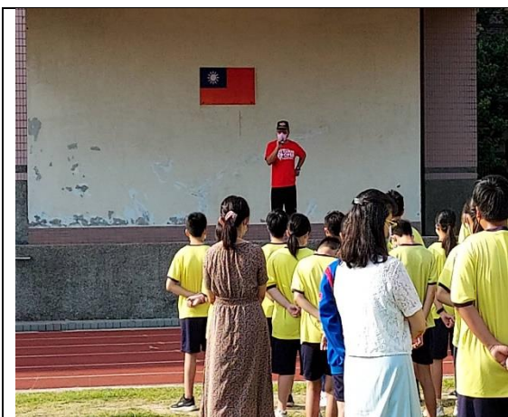
113.6.28 學期末暑假離校菸檳防制宣導