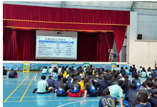
利用朝會進行全民健保講座