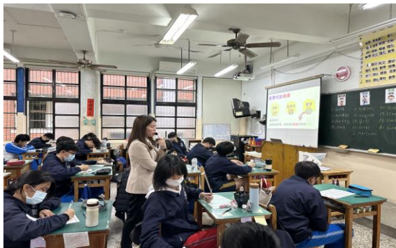
正確用藥教材授課