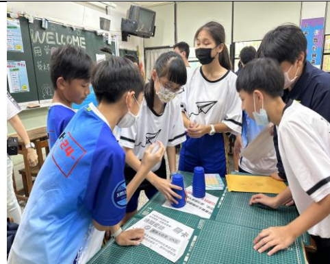
學生以正確用藥為主題設計闖關內容