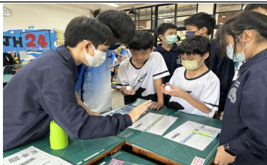
學生以正確用藥為主題設計闖關內容