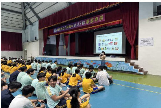
結合校本課程進行全校性講座