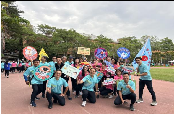
健保用藥議題結合家長會進場