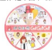
佳作 三民國中 陳郁璇