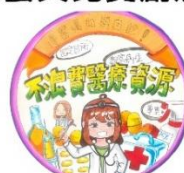
第三名 新科國中 楊欣寧