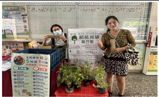
健保用藥議題結合環境教育共同宣導