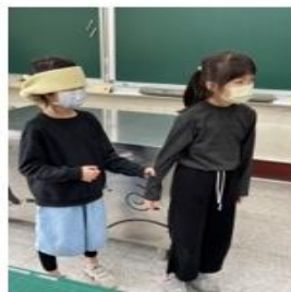
利用道具讓學生體驗眼睛不便的感受（一）