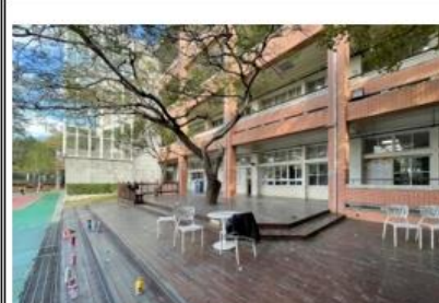
打造圖書館前戶外木平台，讓學生走出戶外（一）