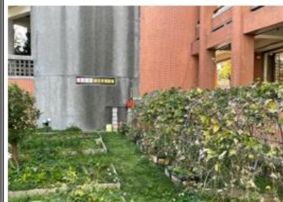
結合食農教育與自然課程，讓學生走出戶外（一）