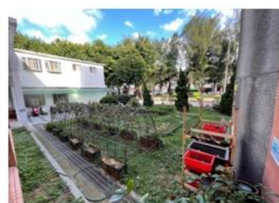
結合食農教育與自然課程，讓學生走出戶外（二）