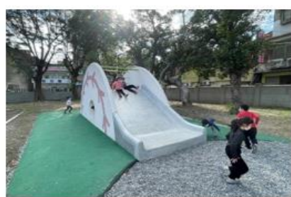
打造新穎遊具，吸引學生戶外活動（二）