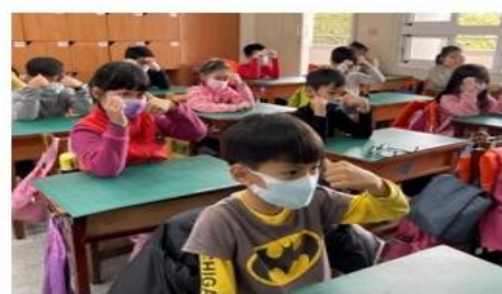
提供優質教案供老師們參考