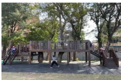
打造新穎遊具，吸引學生戶外活動（一）