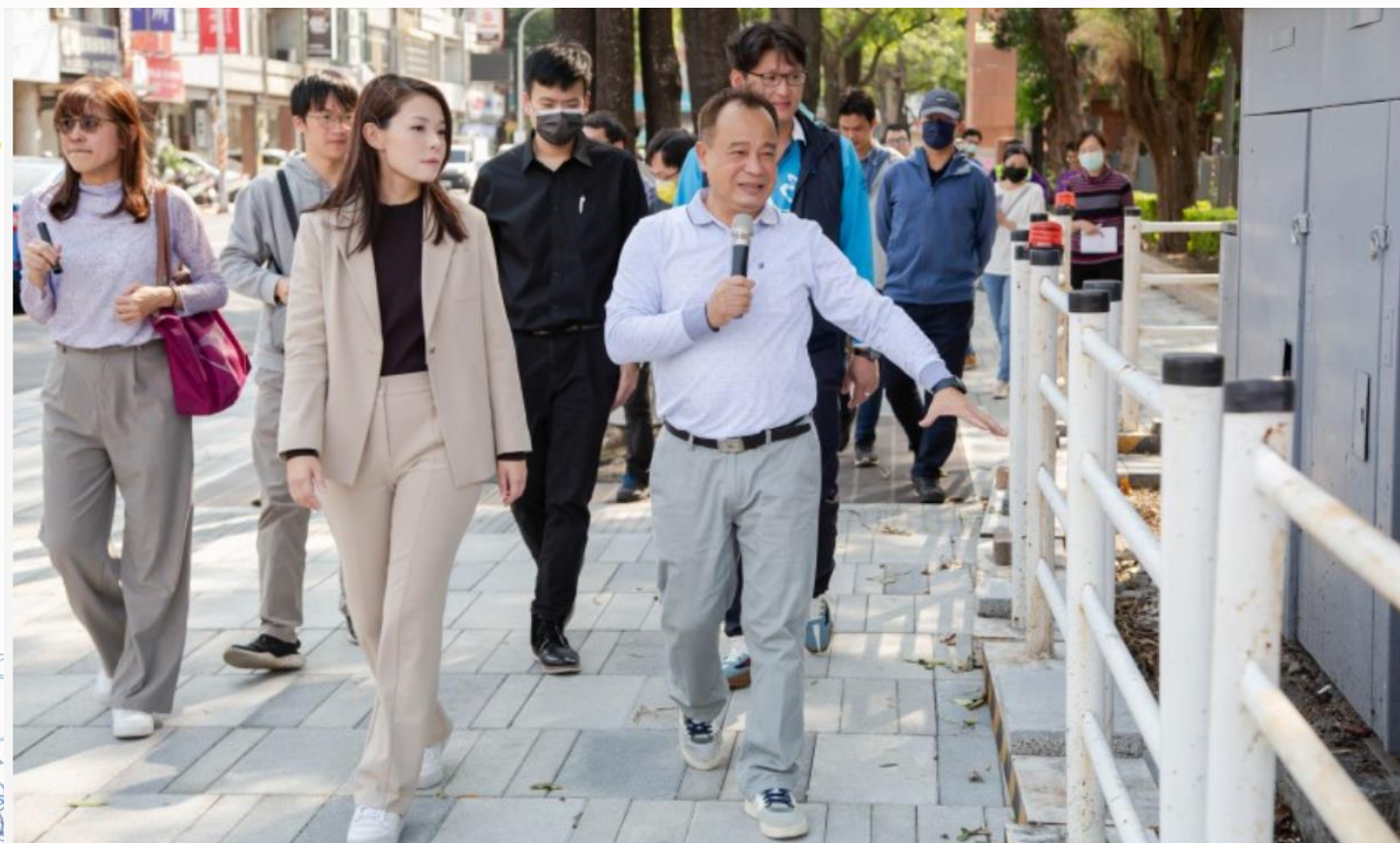
新竹市長高虹安5日前往西門國小視察通學步道工程。