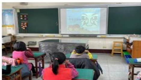
提供優質教案供老師們參考