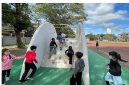
打造新穎遊具，吸引學生戶外活動（三）