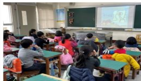
提供優質教案供老師們參考