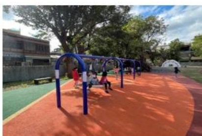
打造新穎遊具，吸引學生戶外活動（四）