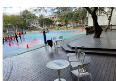
打造圖書館前戶外木平台，讓學生走出戶外（二）