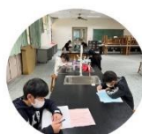
語文競賽融入議題 競賽選手比賽實況