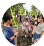
校本課程-大手牽小手 正確使用遊戲器材