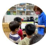
校本課程-一日小志工 健康中心掛號小志工