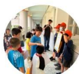
校本課程-大手牽小手 認識健康中心