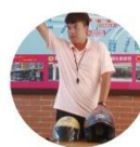
小一新生入學開學活動 交通安全宣導