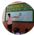
小一新生入學開學活動 校園同建安全地圖