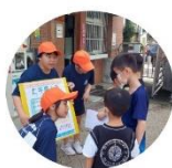
校本課程-大手牽小手 認識警衛室(旁有AED)