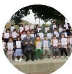
語文競賽融入議題 於兒童議會進行頒獎