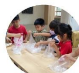
校本課程-一日小志工 健康中心冰塊小志工