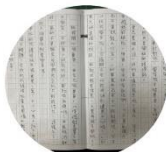
語文競賽融入議題 題目：安全避難的重要