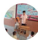
小一新生入學開學活動 防災教育宣導