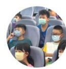
112學年度開學典禮 安全教育宣導