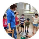
校本課程-一日小志工 緊急傷口處理流程介紹