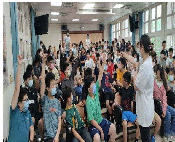
台灣愛盲基金到校公益宣導視力保健的重要，精彩的內容吸引學生們踴躍的回應。