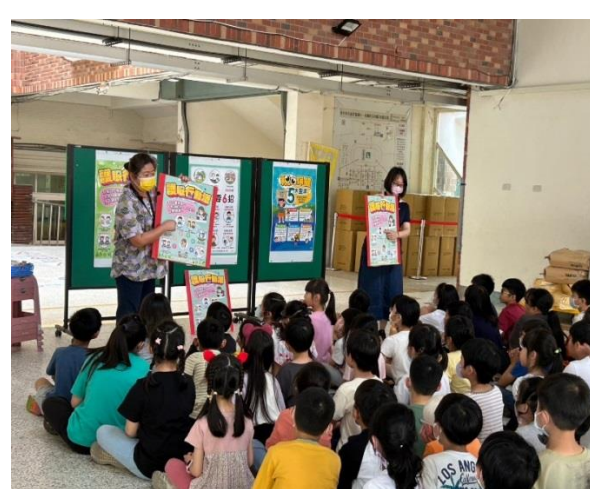
針對課後安親班親辦理『視力保健』健康促進活動。