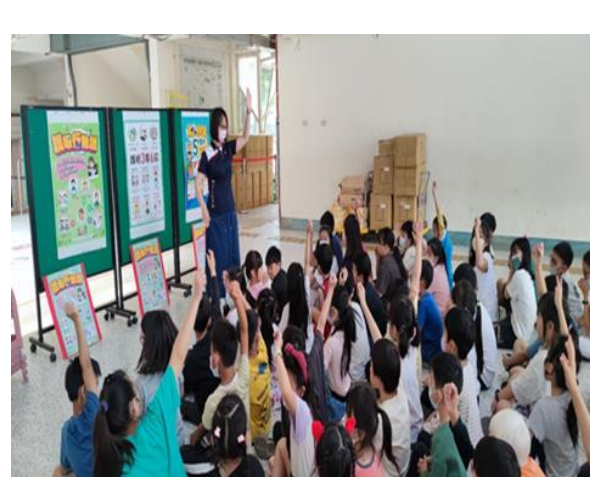
針對課後安親班親辦理『視力保健』健康促進活動，學生反應踴躍。