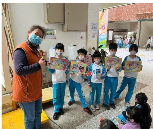
運用健康檢查時的空檔時間，進行『視力保健答題拿好禮』健康促進活動。