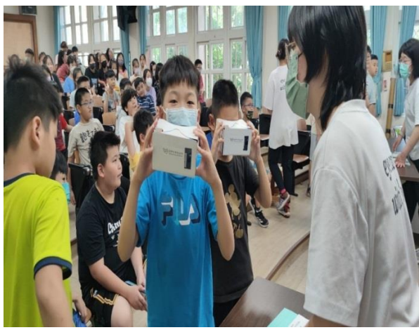
灣愛盲基金會運用儀器讓學生體驗青光眼白內障視網膜剝離的視野，學生驚訝的說：怎麼窗戶變形了。