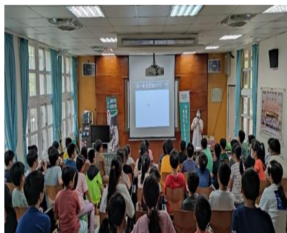
台灣愛盲基金到校公益宣導視力保健的重要，淺顯有趣的內容吸引學生們專注凝聽。