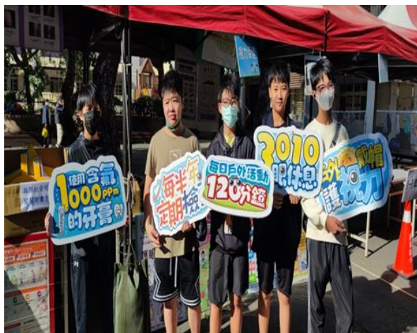
校慶宣導活動~校友來推動健康促進活動。