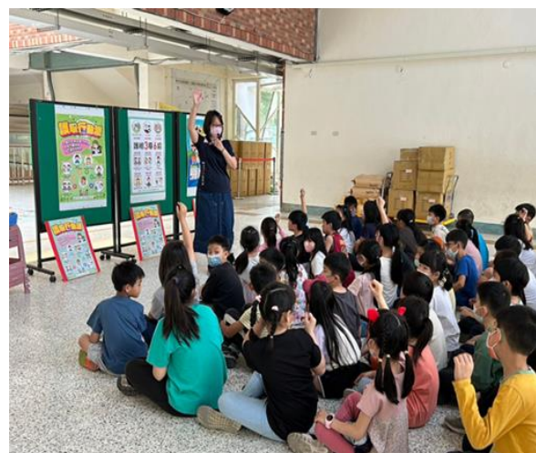
針對課後安親班親辦理『視力保健』健康促進活動。