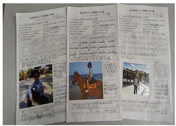
我是健康孩子王學習單-帶帽帶鏡護眼。