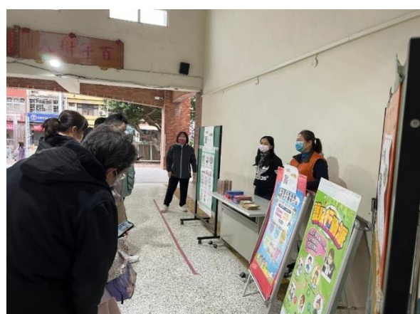
班親會辦理答題拿好禮健康促進活動。