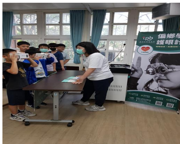
台灣愛盲基金會運用儀器讓學生體驗青光眼白內障視網膜剝離的視野樣貌。