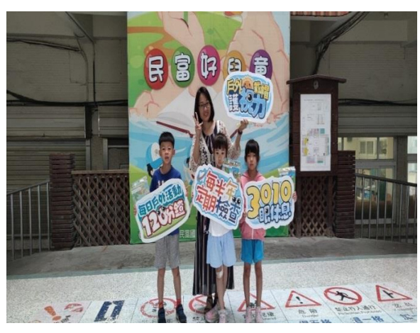
寒假健康孩子王學習單表現優良得獎頒獎。