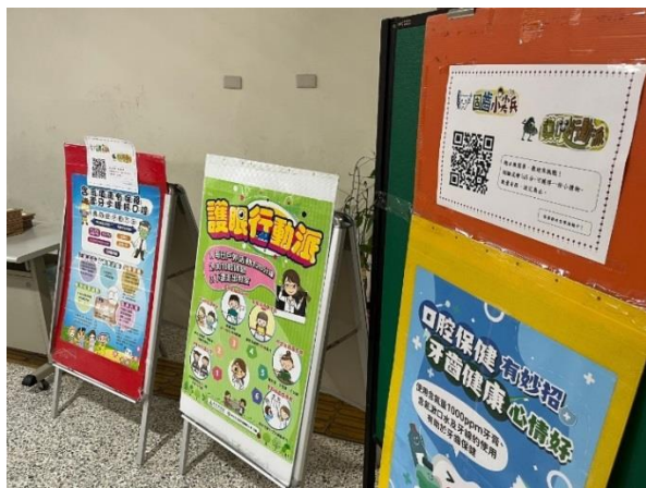
班親會辦理答題拿好禮健康促進活動。