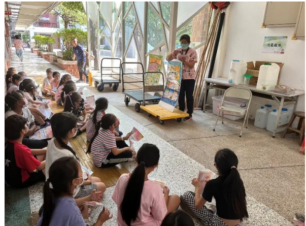
班級健康檢查宣導視力保健妙招。