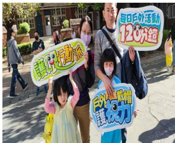
校慶宣導活動~家長支持健康促進活動。