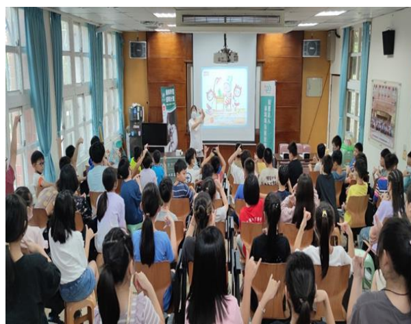
台灣愛盲基金講師教導學生運用雙手簡易測量正確用眼距離。