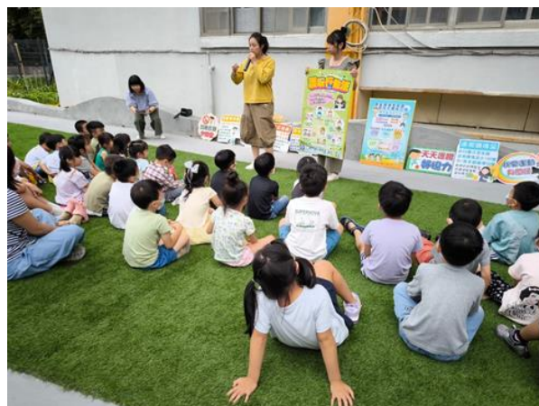
幼兒園-視力保健 宣導