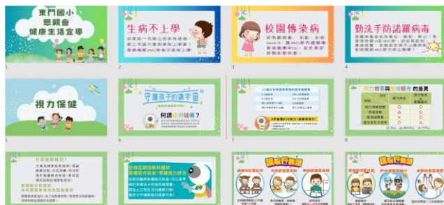
全校懇親會健促宣導