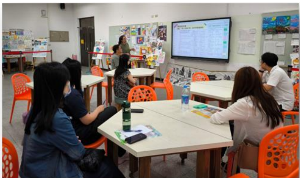
健康促進聯繫會議報告健促推動狀況