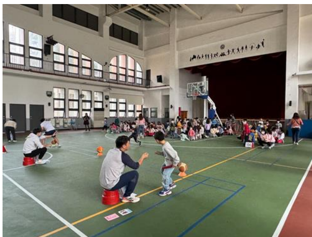
一學年班際競賽-運球