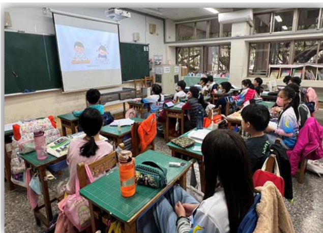
視力保健動態閱讀