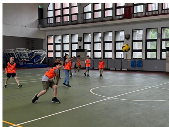
四學年班際球類競賽-躲避球