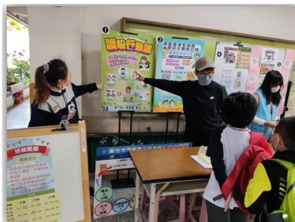
校慶視力保健有獎徵答