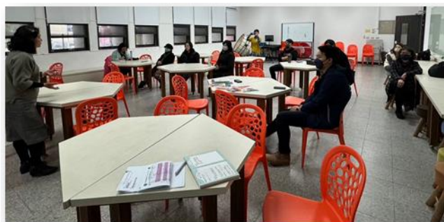
校務會議通過健促計畫