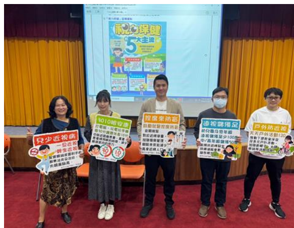
教師會議健康促進宣導