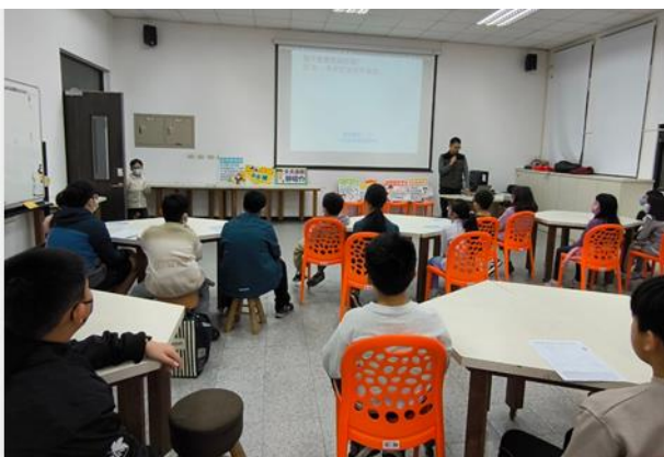
視力保健高度近視個案講座