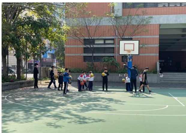
學生課後社團-籃球社