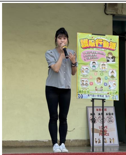
兒童朝會健康促進(視力保健)宣導