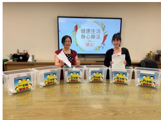
健康生活 身心樂活 摸彩活動