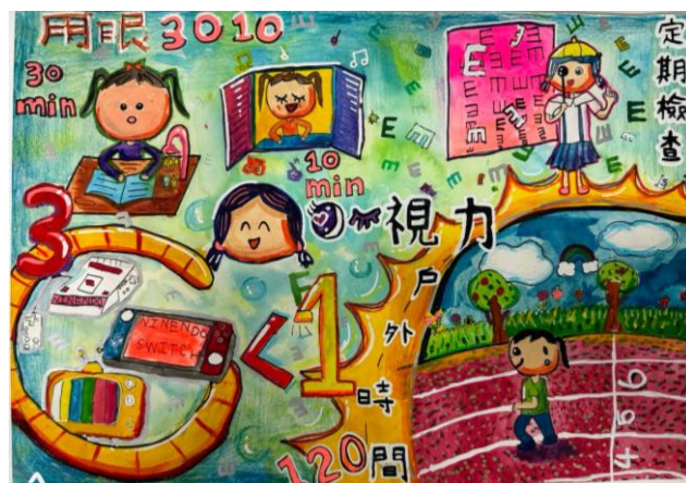
健康促進藝文競賽優秀作品