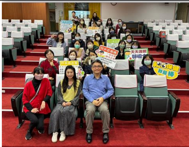
視力保健教師增能研習