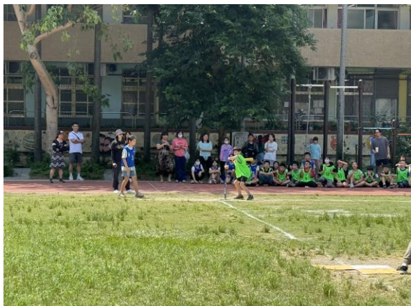
五學年班際球類競賽-樂樂棒