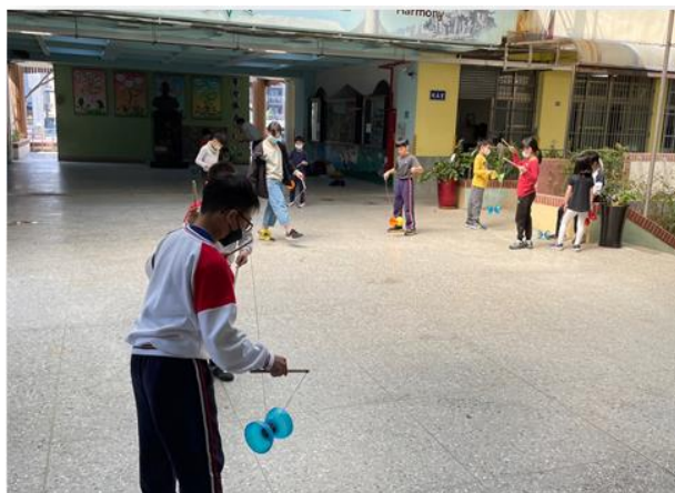
學生課後社團-扯鈴社