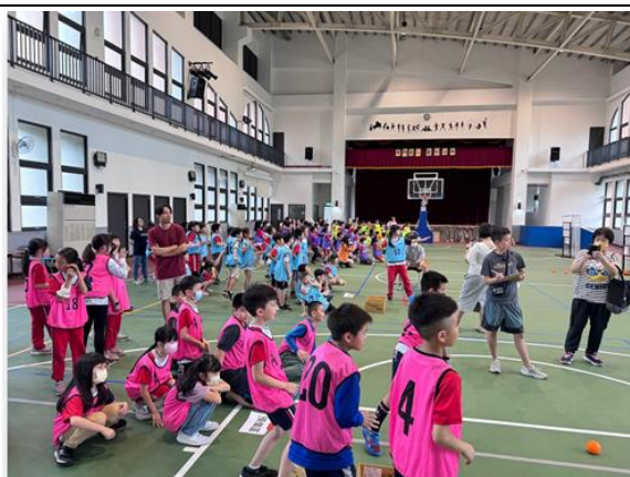
三學年班際球類競賽-九空格