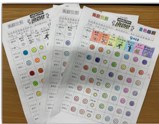
健康生活 身心樂活學習單