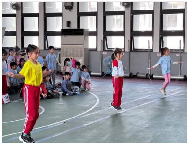
二學年班際競賽-跳繩