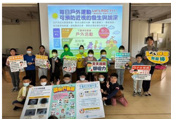
視力保健高關懷班級宣導講座