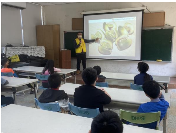
菸檳防制宣導-陽光基金會