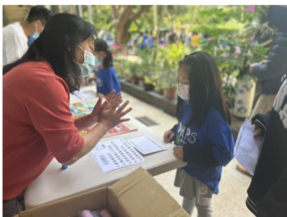
親子日設置口腔衛生宣導攤位