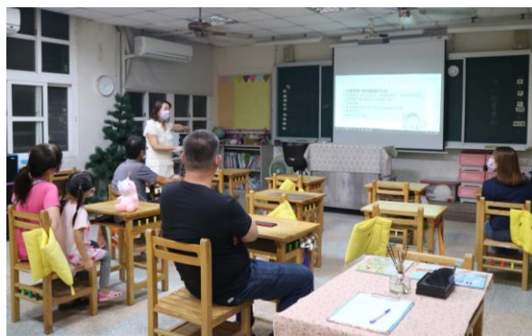
口腔保健宣導-親師座談會