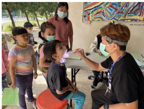
每學期辦理口腔檢查