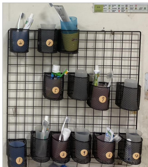
每班設置牙刷用具杯架