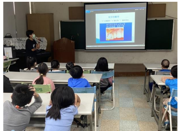
預防齲齒宣導-校牙醫