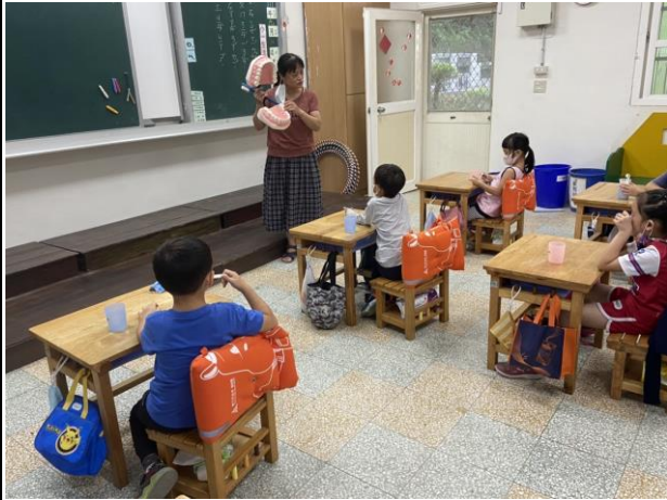
貝氏刷牙法教學(一年級)