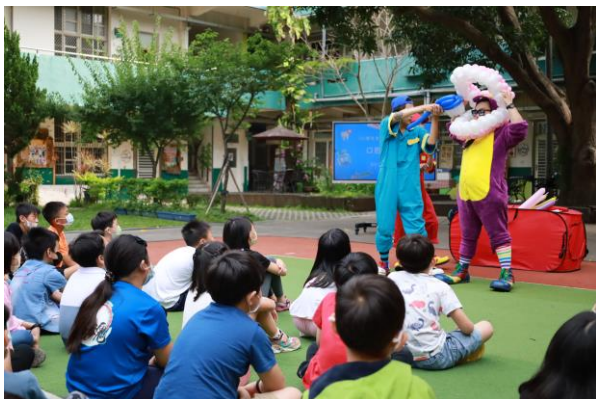
口腔保健戲劇-好玩的劇團