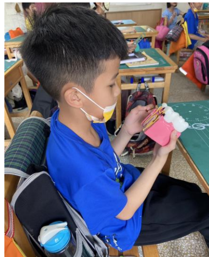
口腔衛生宣導(牙齒構造)-護理師