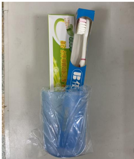
每學期提供學生一組潔牙用具