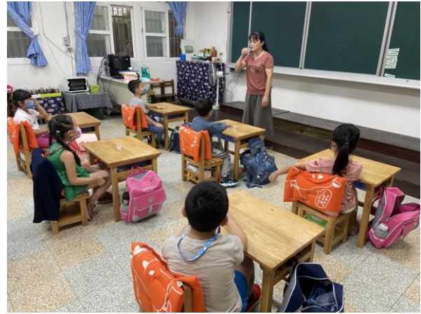
漱口水教學(一年級)