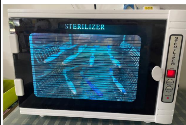
每班設置牙刷專用的紫外線消毒箱