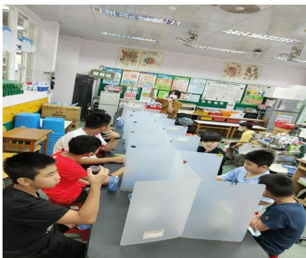
口腔保健課程-牙菌斑小檢驗 1