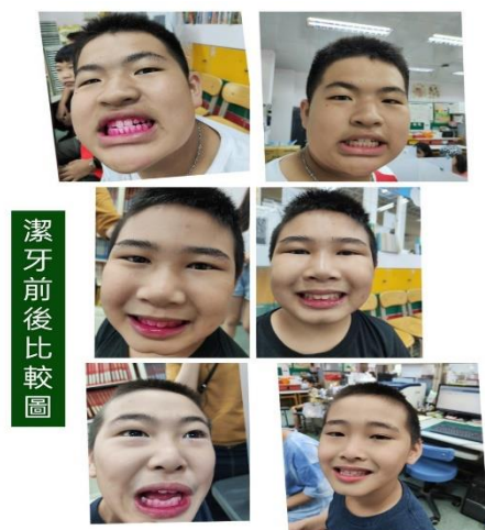
口腔保健課程-牙菌斑小檢驗 2