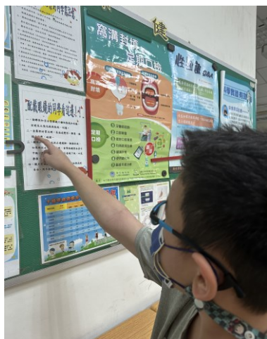
協助就醫配鏡及衛生教育