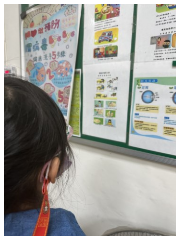
協助就醫配鏡及衛生教育