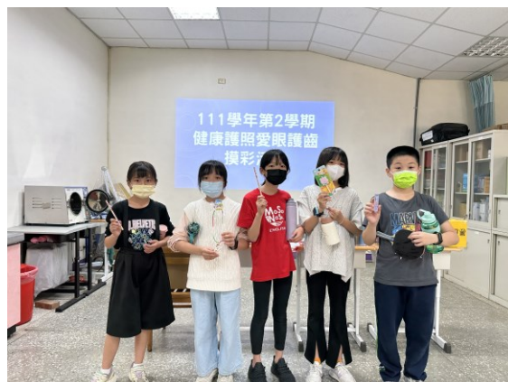
健康護照愛眼護齒摸彩活動