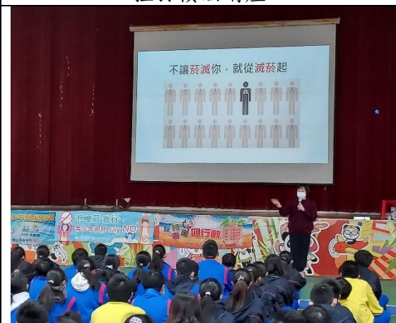
111.2.24 香山衛生所菸檳防制宣導~ 從滅菸做起