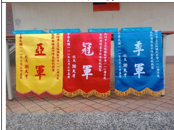
111. 3. 25 反菸拒檳盃十項全能挑戰賽 ~反菸拒檳盃錦旗