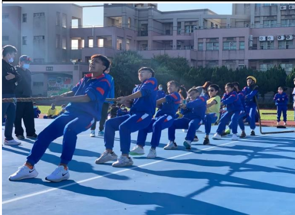
110. 11. 15 反菸拒檳盃拔河比賽