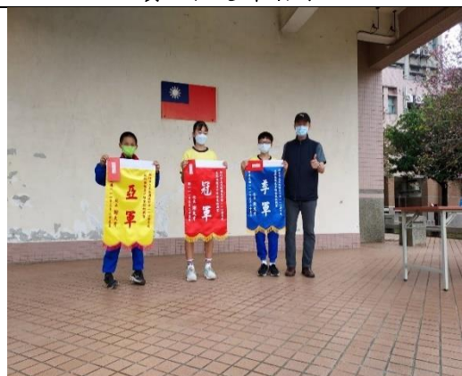
111. 3. 25 反菸拒檳盃十項全能挑戰賽 ~反菸拒檳盃頒獎