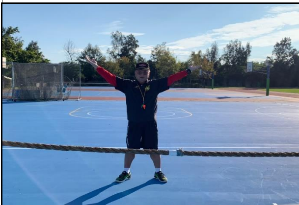
110. 11. 15 反菸拒檳盃拔河比賽