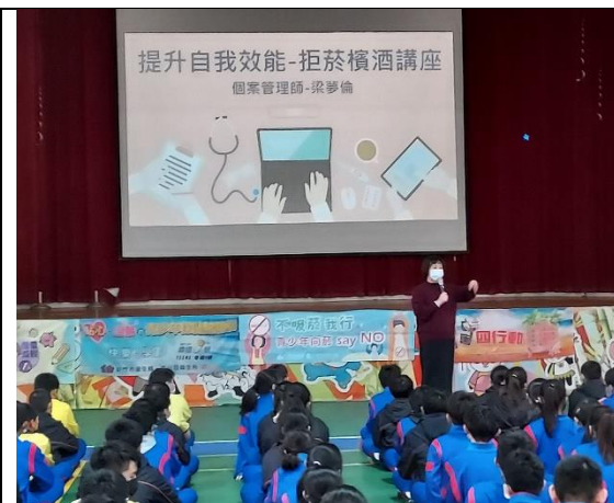
111.2.24 香山衛生所菸檳防制宣導~ 拒菸檳酒講座