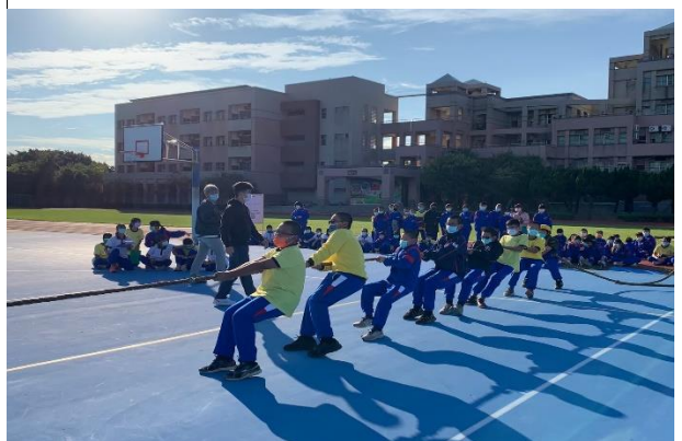
110. 11. 15 反菸拒檳盃拔河比賽