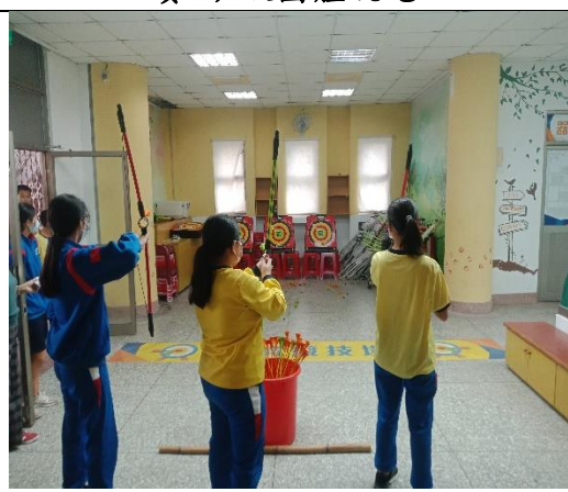
111. 3. 25 反菸拒檳盃十項全能挑戰賽 ~誰是神射手