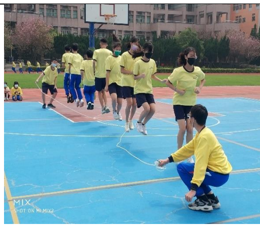
111. 3. 25 反菸拒檳盃十項全能挑戰賽 ~班級團體跳繩