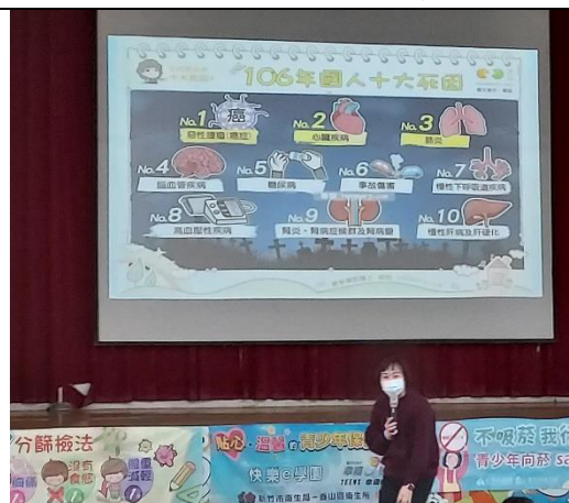
111.2.24 香山衛生所菸檳防制宣導 ~國人十大死因