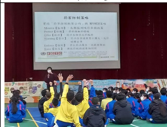
111.2.24 香山衛生所菸檳防制宣導~ 菸害防治策略