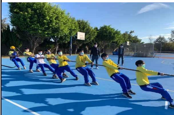
110. 11. 15 反菸拒檳盃拔河比賽