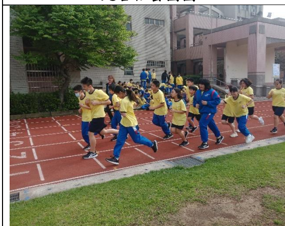
111. 3. 25 反菸拒檳盃十項全能挑戰賽 ~班級團體跑步