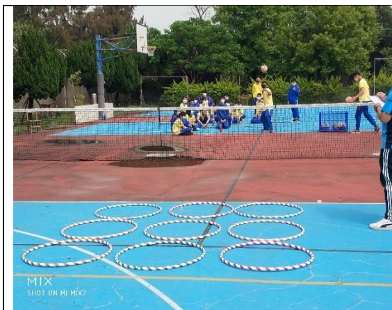
111. 3. 25 反菸拒檳盃十項全能挑戰賽 ~九宮格套圈圈