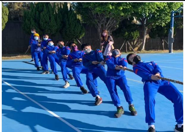
110. 11. 15 反菸拒檳盃拔河比賽