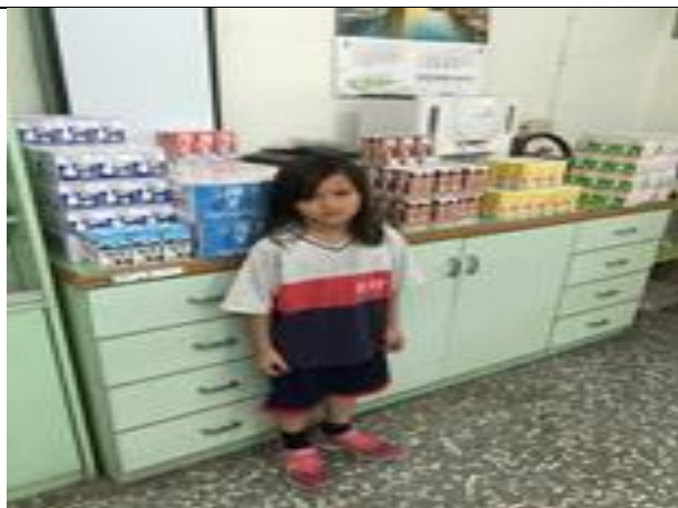
說明：營養補給方案