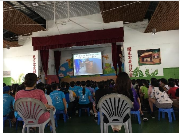
東園國小-以實例說明網友的危機與傷害並進一步解構騙局的伎倆，提醒學生不要輕易上傳私密照片。