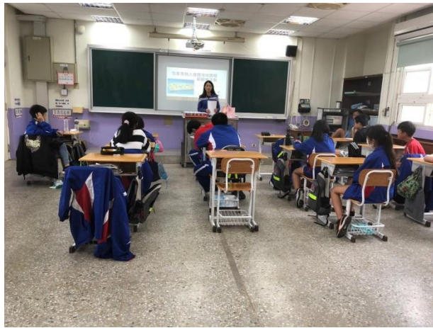
富禮國中-性教育融入健體領域課程，再搭配小遊戲，加深學生的感受與印象。