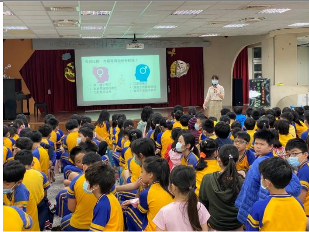
三民國小-性別平等教育講座~男女大不同?!