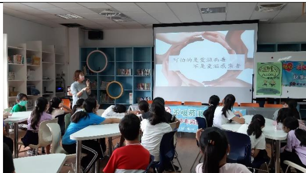
香山國小-愛滋病防治宣導-認識愛滋病的傳染途徑，導正一些迷失觀念，