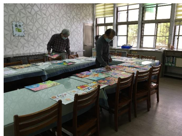
全市性教育與愛滋防治藝文競賽評