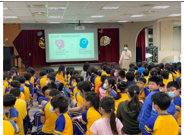
載熙國小-性平教育宣導