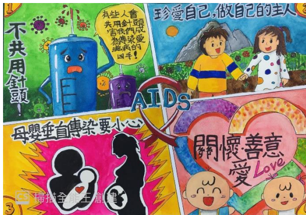
全市性教育與愛滋防治藝文競賽得獎作品~~國小組