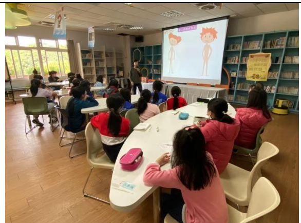
香山國小-女生青春期衛教宣導-認識第二性徵與月經期間的相關知