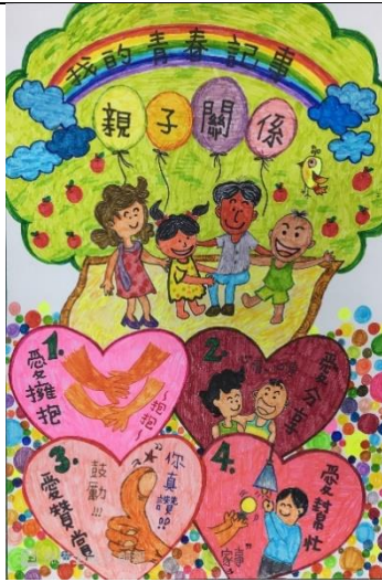
全市性教育與愛滋防治藝文競賽得獎作品~~國小組