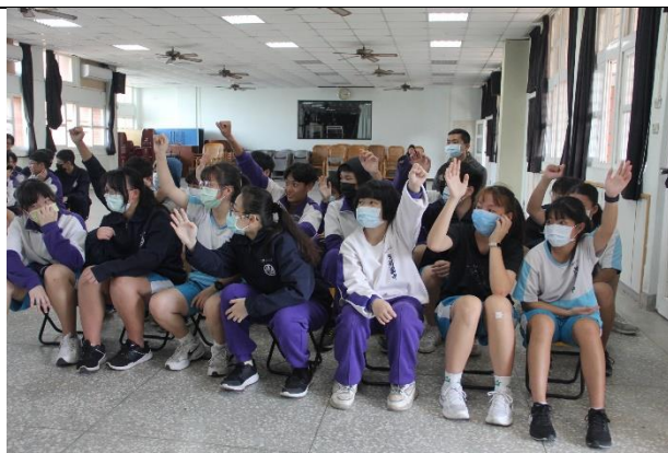
內湖國中-愛不是與生俱來的本能講