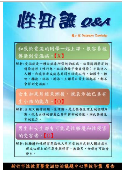
國小版性知識Q&A海報印製給全市國