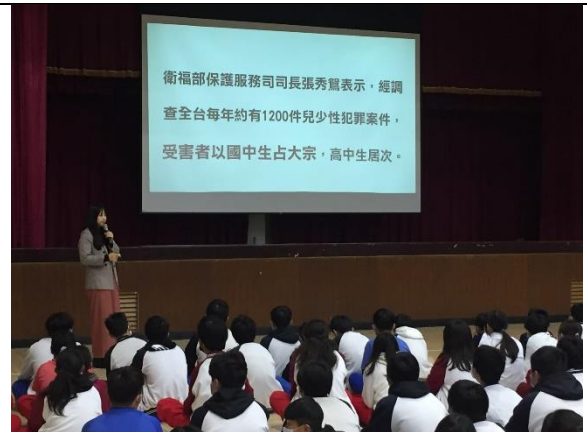
建華國中-「要私密照？」-不拍攝、不引誘、不散步、不持有，避免成為加害人或幫兇。