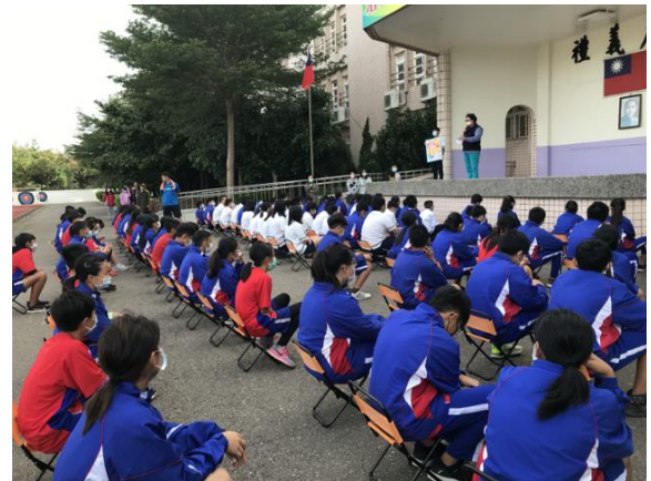
富禮國中-輔導室與學處處合作辦理網路交友停看聽短劇宣導。