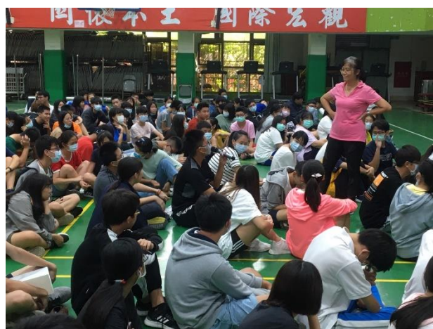
成德高中-性教育暨愛滋防治宣導以及指導保險套的使用