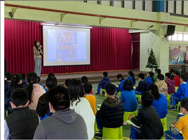
港南國小- 新竹市香山區警察局女警，到校進行防治性騷擾宣導活動。