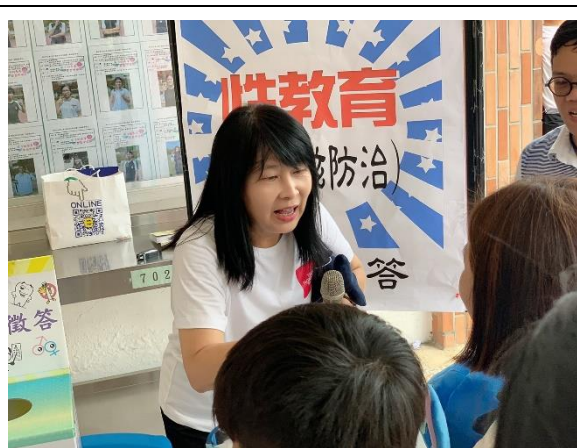
香山高中-校慶園遊會有獎徵答活