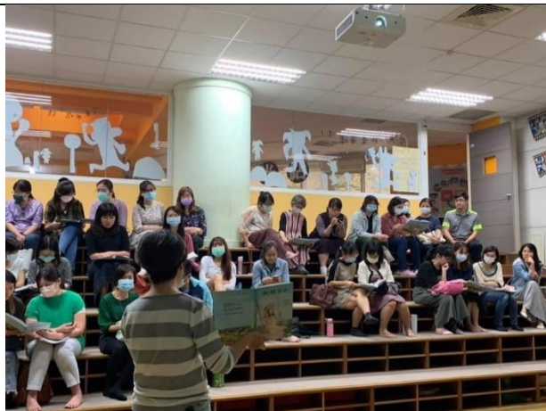
陽光國小-教師增能研習-蝴蝶朵朵到性別平等