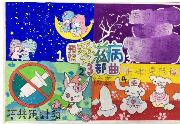
全市性教育與愛滋防治藝文競賽得獎作品~~國中組