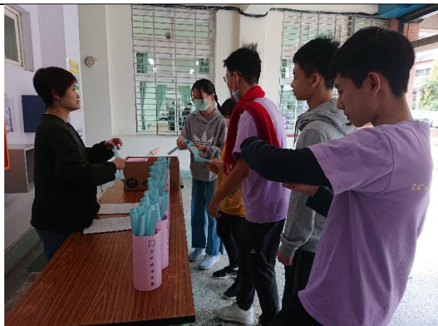
建功高中-配合校慶進行性教育宣導及闖關活動