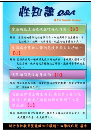
國中版性知識Q&A海報印製給全市國