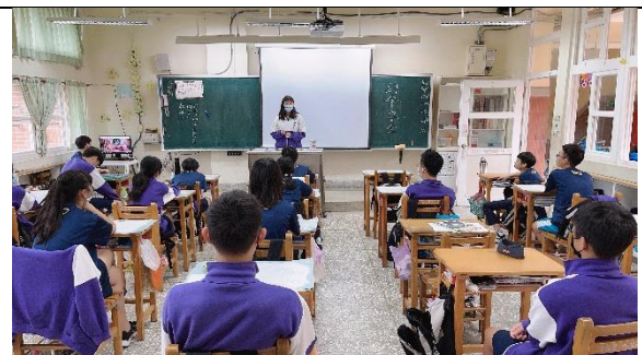
內湖國中-班會討論-兩性交往及約