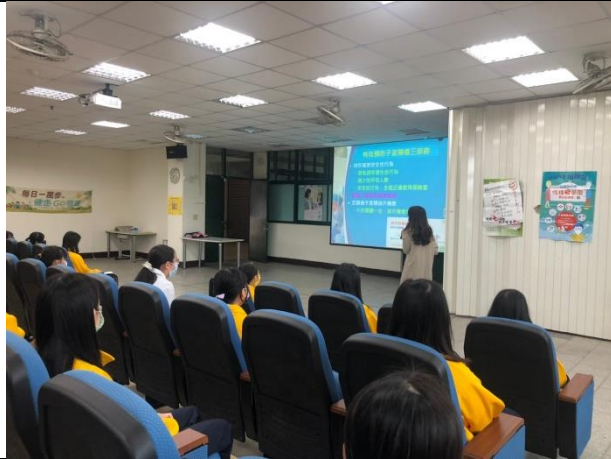
新科國中-子宮頸衛教講座