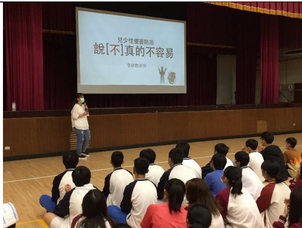
建華國中-說(不)真的不容易-要重視自己身體的感覺，練習說不。