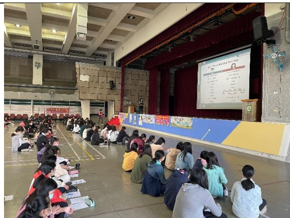
建功高中- HPV 疫苗接種衛教與施打