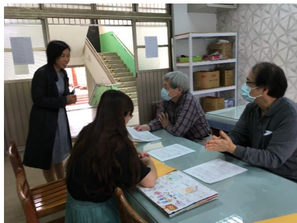
全市性教育與愛滋防治藝文競賽評