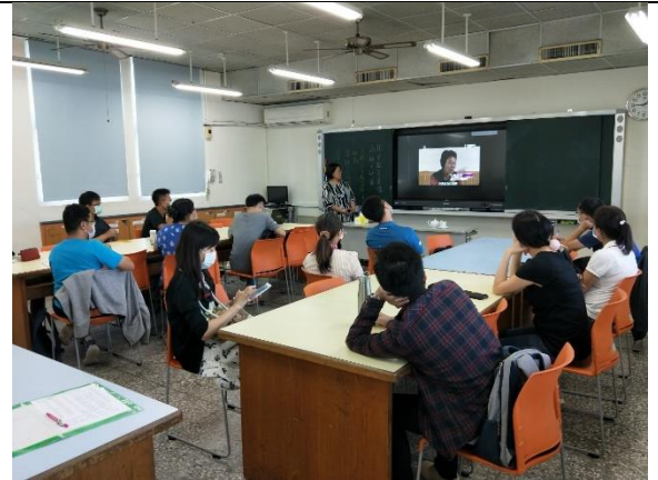
港南國小-研習所得相關知能進行校內教師分享