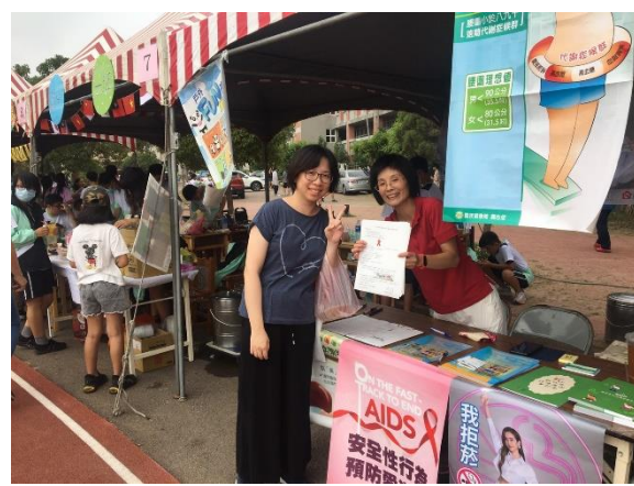
成德高中-配合校慶進行愛滋防治宣導