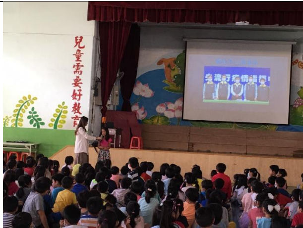
東園國小-引導尊重並包容別人跟你的不一樣，以公平的態度看待世上的每一個人，避免性別歧視。