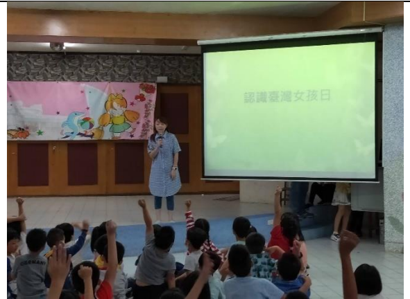
朝山國小-認識台灣女孩日