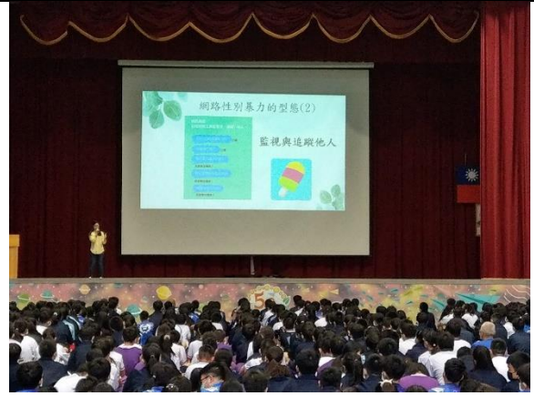
培英國中-網路性暴力宣導-教導學生認識網路性別暴力的型態以及網路須知。