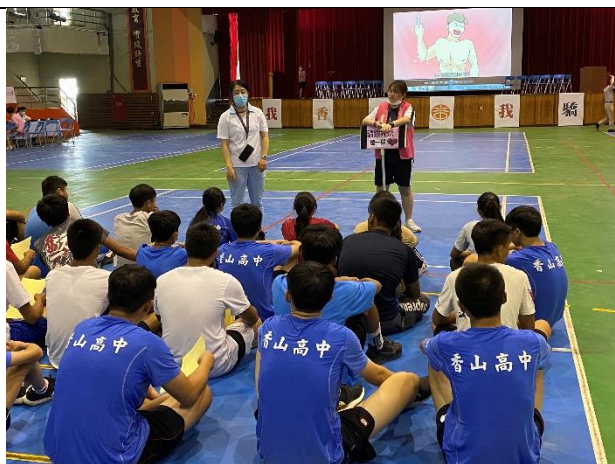
香山高中-高一新生體檢暨健康促進