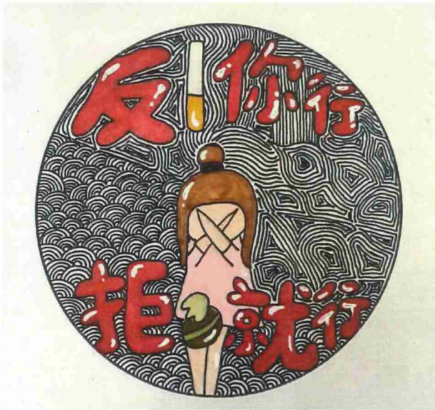
說明：110-3 月反菸拒檳海報設計比賽