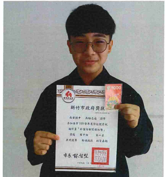
說明：110 年反菸拒檳海報設計比賽榮獲第一名