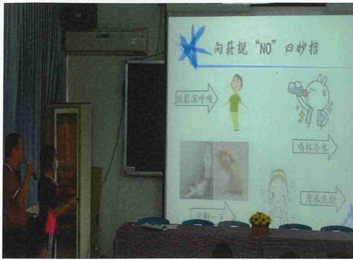
說明：109-9-19 親師日健康議題宣導