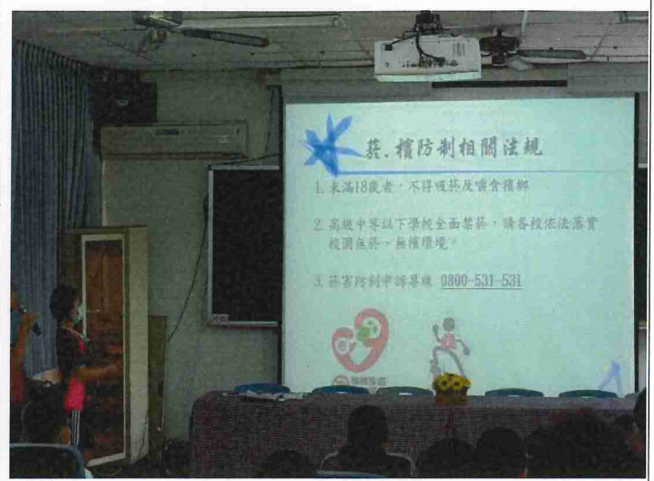
說明：109-9-19 親師日健康議題宣導