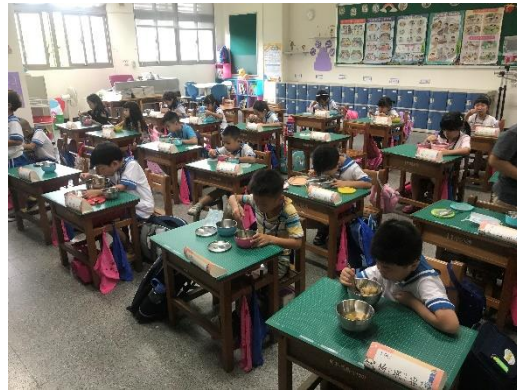
均衡營養又健康的營養午餐