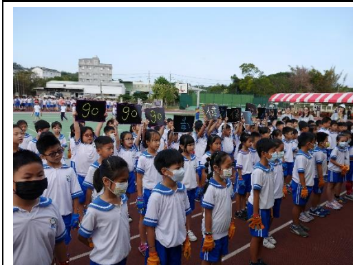
校慶進場活動-學生高喊視力保健口號