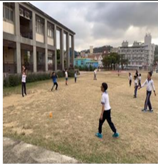
課後運動班-樂樂棒球