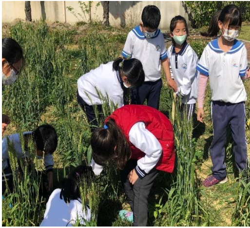
特色課程-食農教育