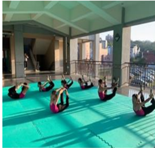
課後運動班-舞蹈教學