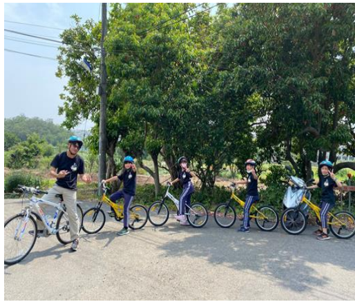
特色課程青草湖自行車巡禮