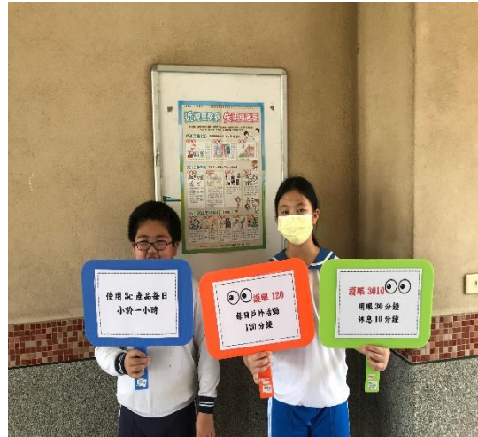
跳蚤市場-視力保健宣導攤位