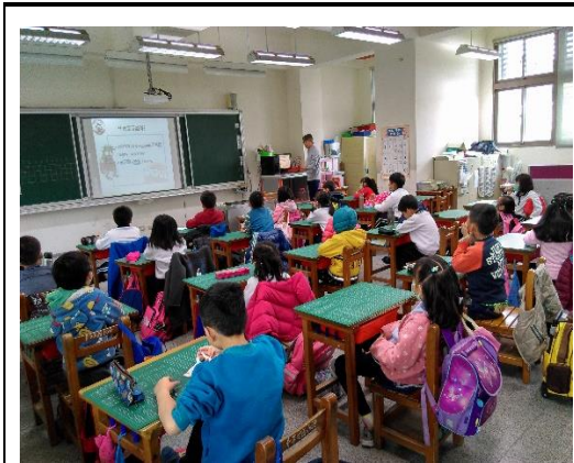
依學生身高調整適合課桌椅