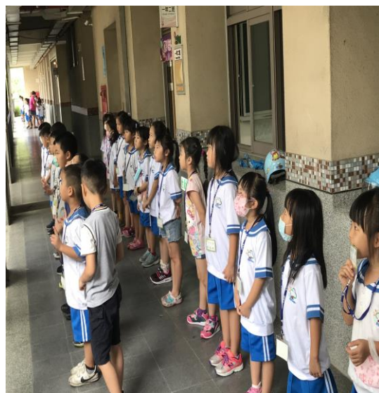
週二大下課全校護眼操