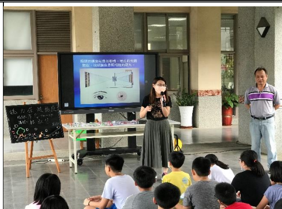
護理師宣導視力保健