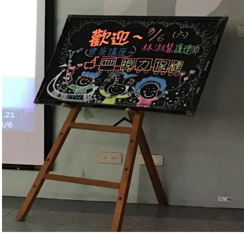
109 學年度親師視力保健增能研習