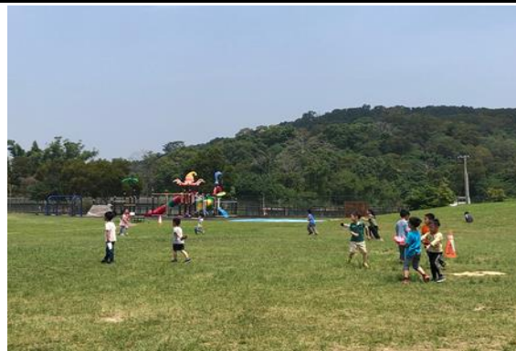
教室淨空-學生下課離開教室盡情玩樂