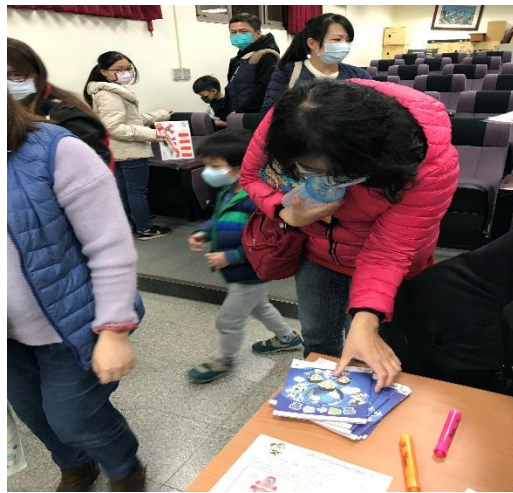
家長領取視力保健文宣品