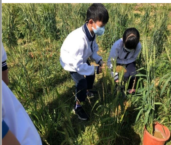
食農教育-小麥採收