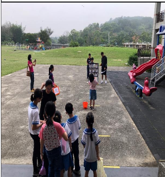
跳蚤市場-投爆惡視力