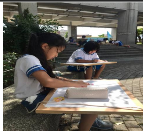
視力保健-望遠凝視之寫生活動