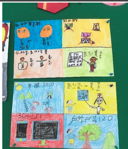
幸福藝廊展示視力保健文藝作品