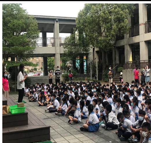
護理師對全校師生做視力衛教宣導