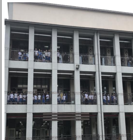
每週二大下課進行護眼操