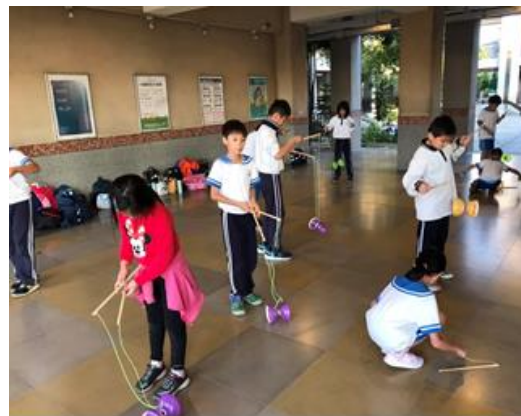
課後運動班-扯鈴教學