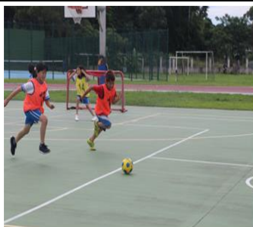
課後運動班-樂樂足球