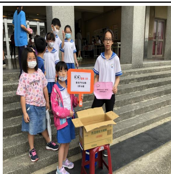
跳蚤市場-視力知識 Q&A