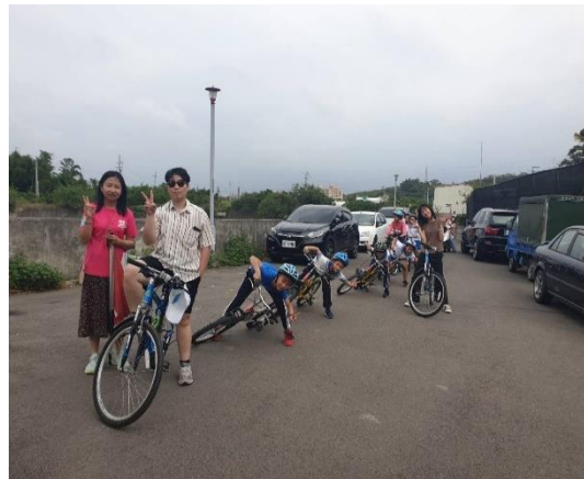
特色課程青草湖自行車巡禮