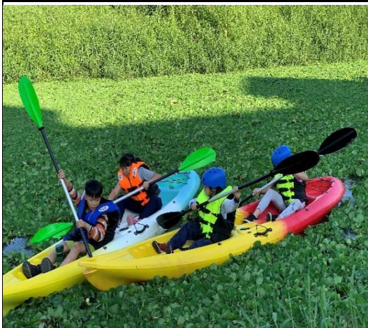
校本課程客雅溪獨木舟體驗