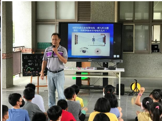
視力保健講座-校長致詞