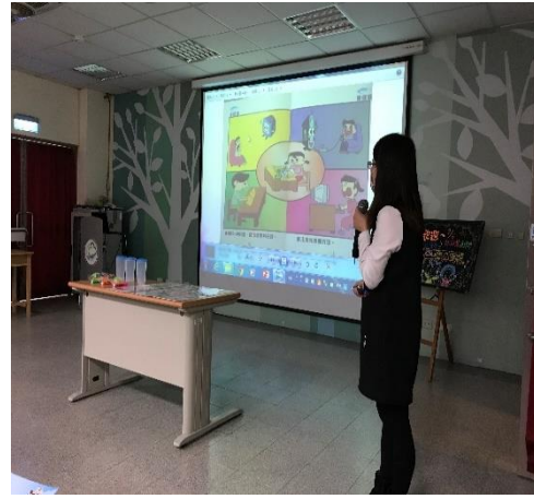
109 學年度視力保健親師研習