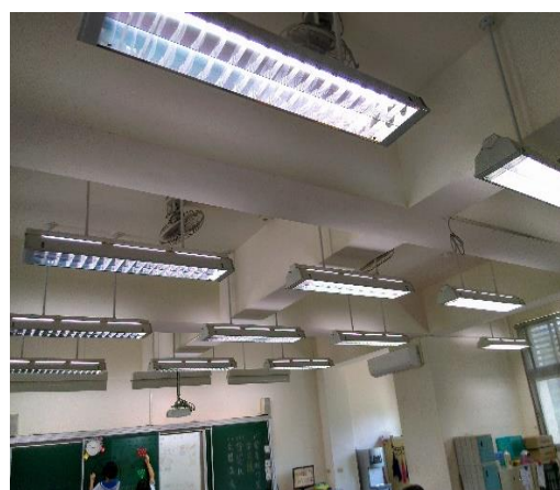
教室燈光足夠明亮