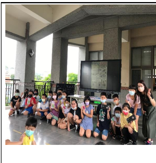
獲獎同學與護理師合照