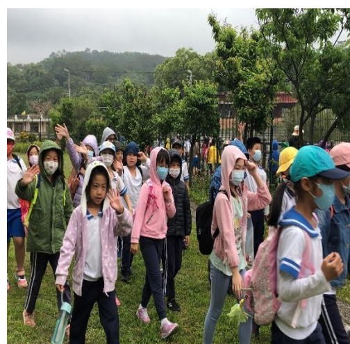
特色課程-客雅溪踏查