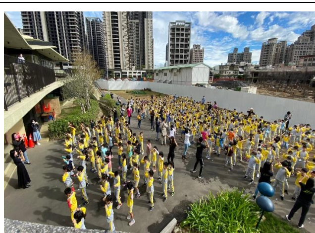
校慶開場舞蹈(親師生同歡)