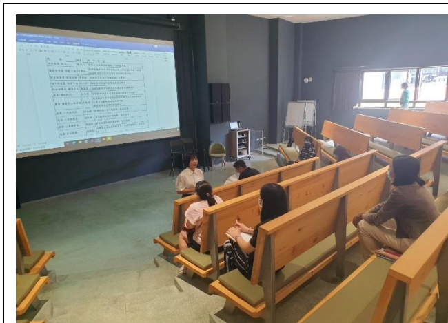
健康促進聯繫會議