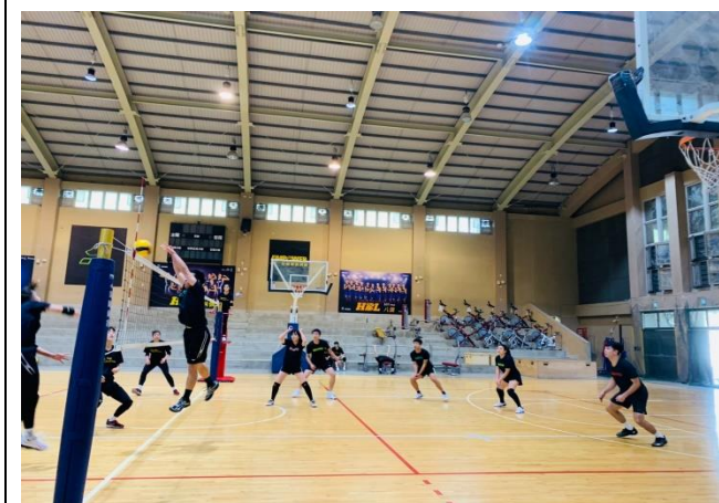
教師運動社團(排球運動)