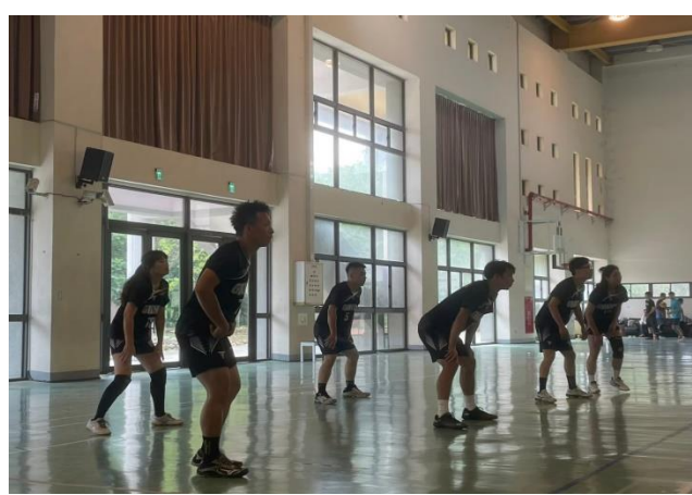
教師運動社團(排球運動)