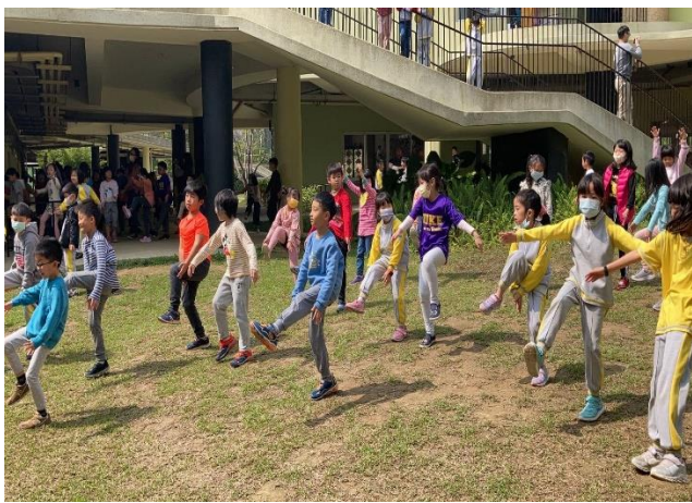
課間活動(TABATA 循環體能)