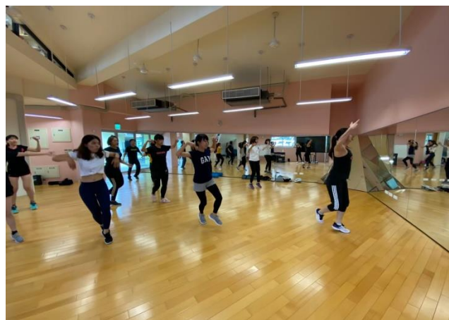
教師運動社團(有氧舞蹈)