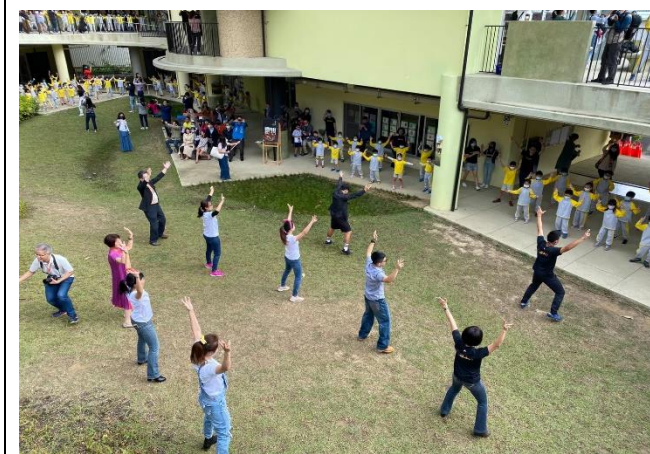
校慶開場舞蹈(親師生同歡)