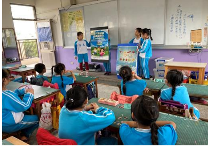
說明：健康小天使進行班級視力保健宣導