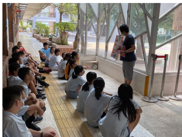
說明：進行視力保健宣導