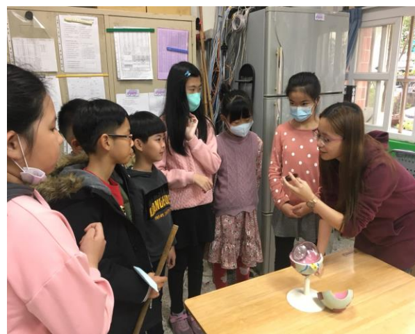
說明：利用眼球教具進行宣導