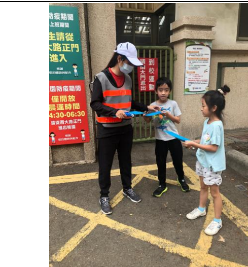
說明：鼓勵學生多走路上學，蓋章集點活動