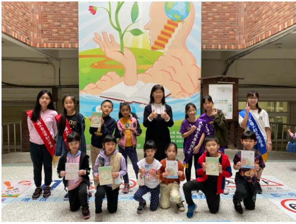
說明：闖關單抽獎活動