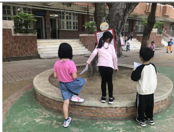
說明：健康促進闖關活動