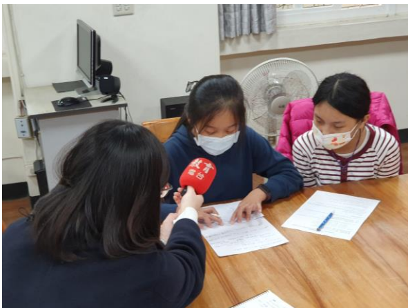
說明：學生自治市長接受電台採訪校園中視力保健的相關活動