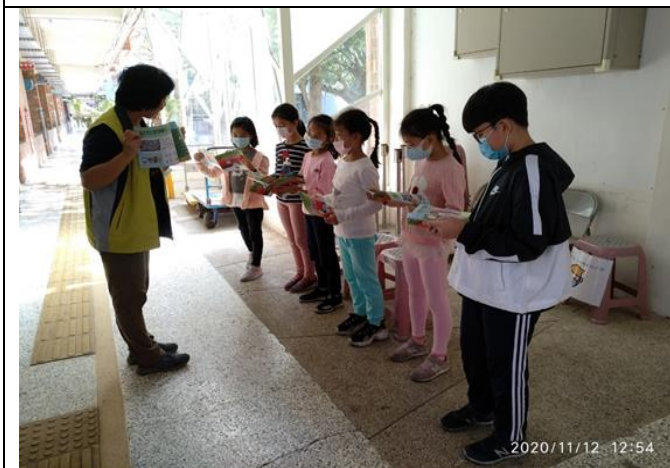
說明：健康小天使入班級宣導前的行前說明