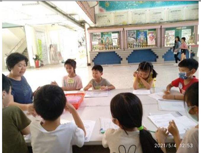
說明：學生的個管活動