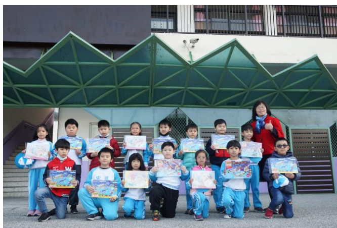
說明：健康檢核表摸彩活動