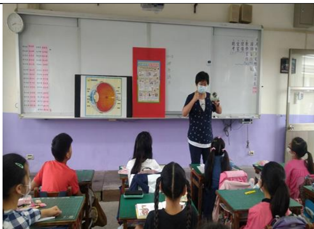
說明：細心叮嚀~視力保健宣導