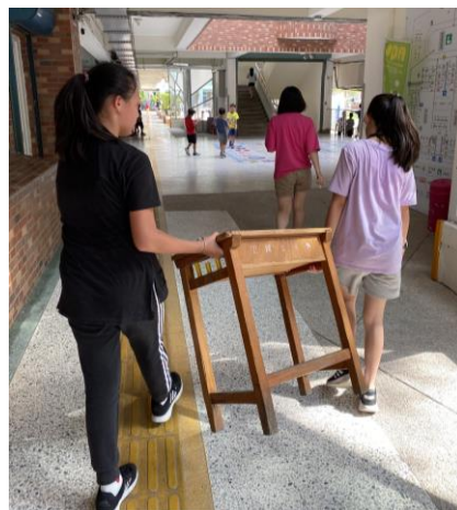
說明：視力保健-更換適合身高的課桌椅