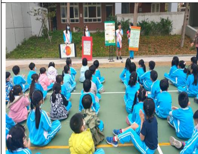
說明：學生自治幹部進行視力保健宣導