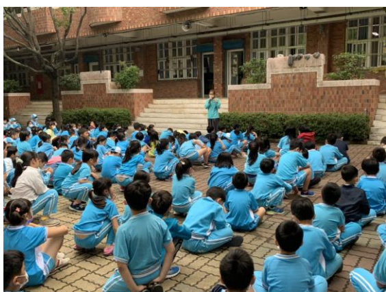
說明：學生朝會~進行視力保健宣導