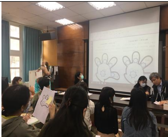
說明：教師會議闖關活動宣導