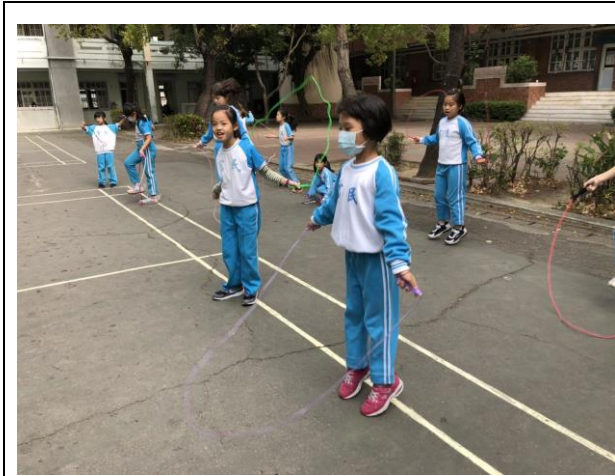
說明：校內推動各項體育活動