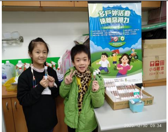
說明：視力回條繳交後領取班級禮物