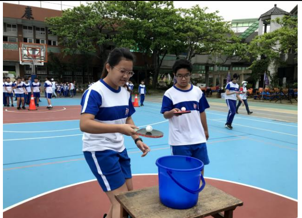
照片說明：校慶大運動會-六年級趣味競賽