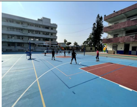
照片說明: 寒假育樂營