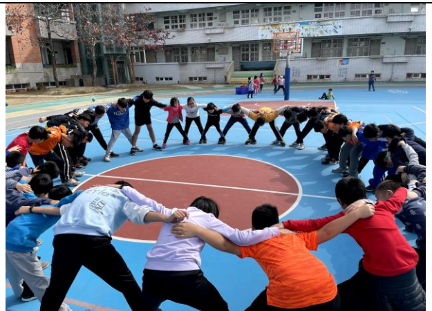
照片說明: 寒假育樂營