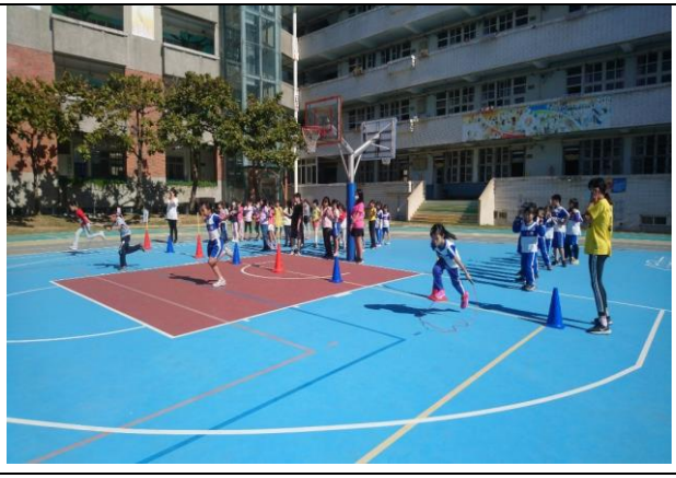
照片說明：考後運動-三年級