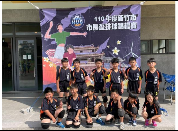
照片說明：參加全市排球比賽-五年級