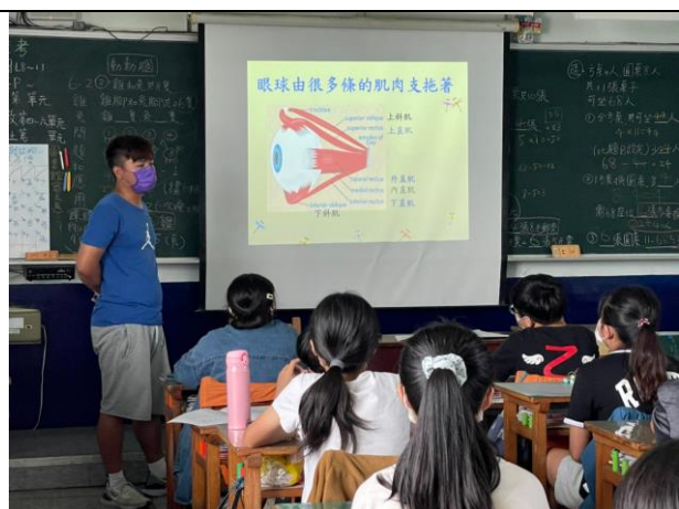
照片說明: 5 月視力保健宣導-眼睛構造