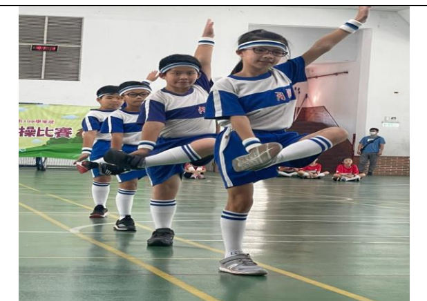
照片說明：全市健康操-四年級