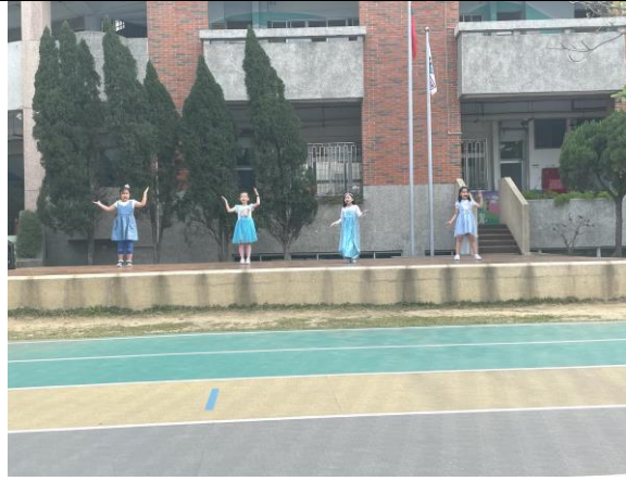
照片說明: 109 學年度才藝 PK