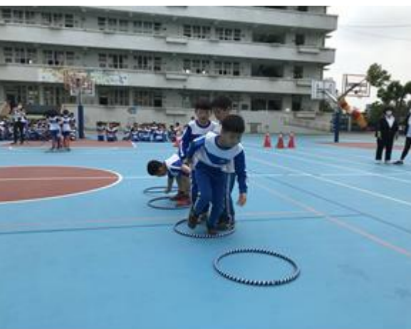
照片說明：校慶大運動會-一、二年級趣味競賽