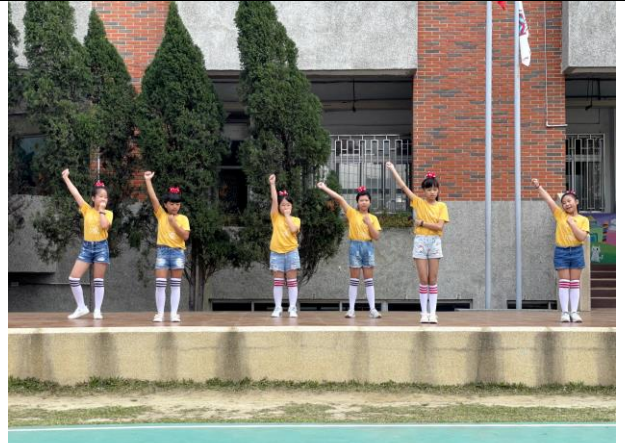
照片說明: 109 學年度才藝 PK