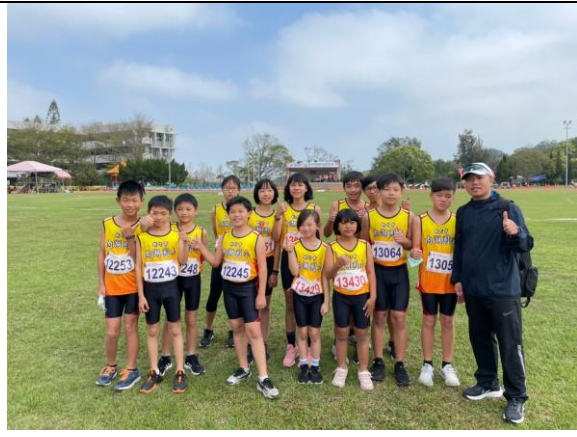
照片說明：參加全市運動會