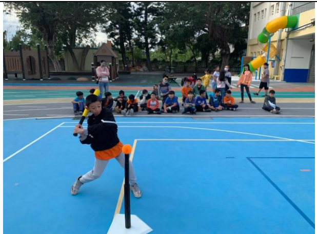
照片說明：考後運動-五年級