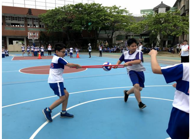
照片說明：校慶大運動會-三、四年級趣味競賽