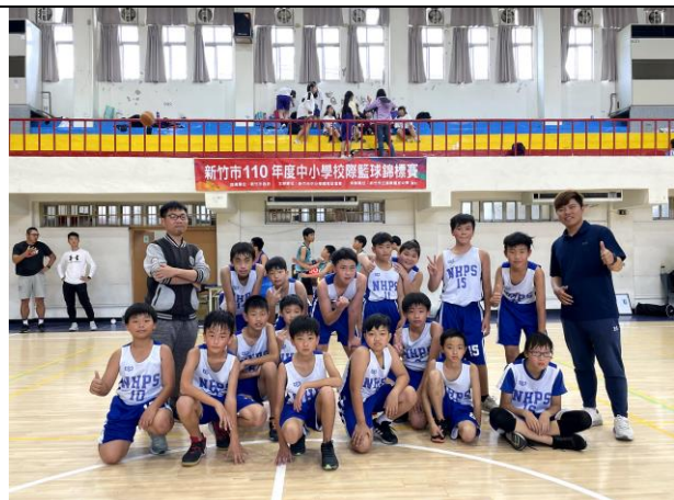
照片說明：參加全市中小學籃球錦標賽