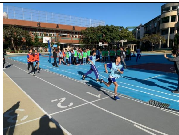
照片說明：校內大隊接力競賽