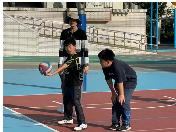
照片說明: 課後運動班-排球