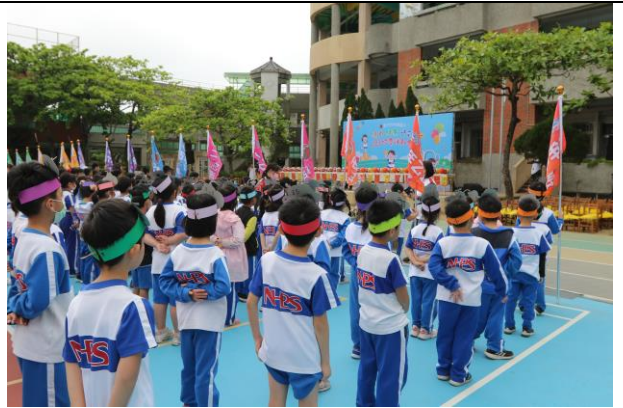
照片說明：103週年校慶大運動會