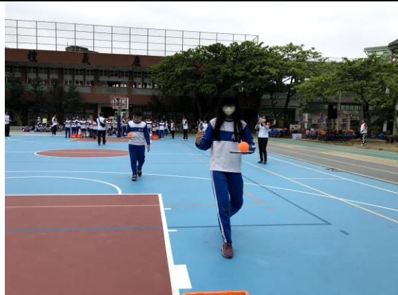
照片說明：校慶大運動會-五年級趣味競賽