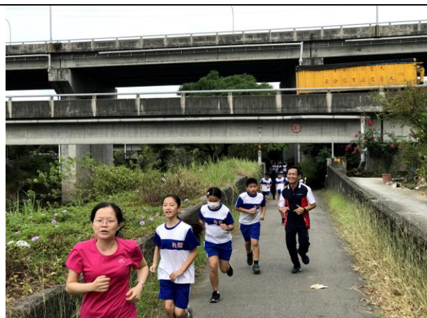
照片說明: 鹽水溪路跑-師長陪伴