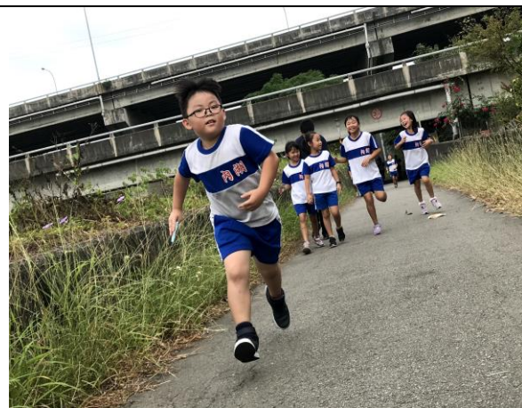
照片說明: 鹽水溪路跑