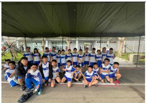
照片說明：參加全市大隊接力