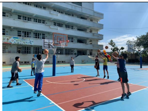
照片說明：考後運動-六年級