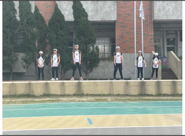
照片說明: 109 學年度才藝 PK