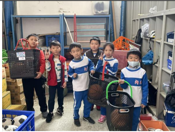
照片說明: 班級器材發放-下課 10 分鐘