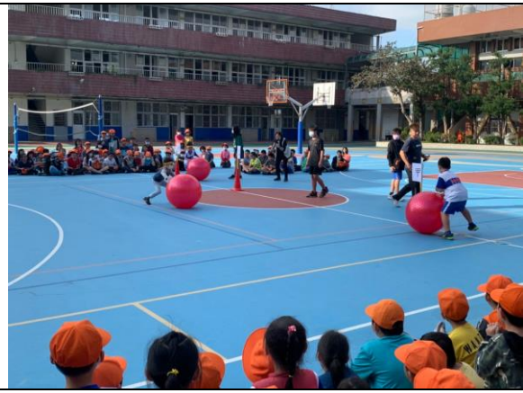
照片說明：考後運動- 一、二年級