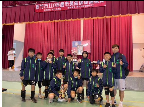
照片說明：參加全市排球比賽-六年級