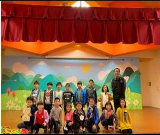
照片說明: 109 學年度三冠王(視力、口腔、體位)