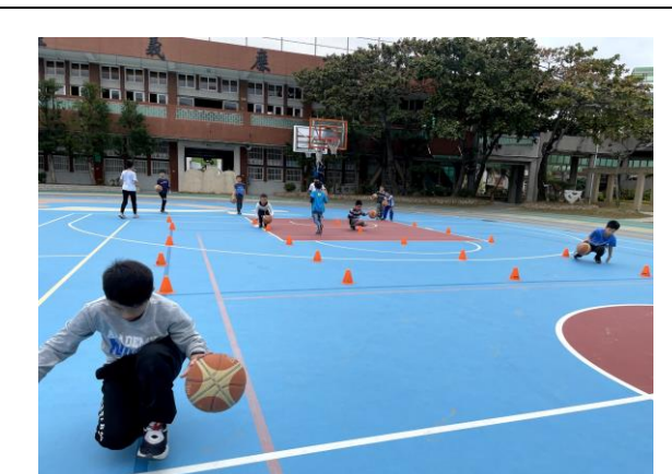
照片說明: 課後運動班-籃球