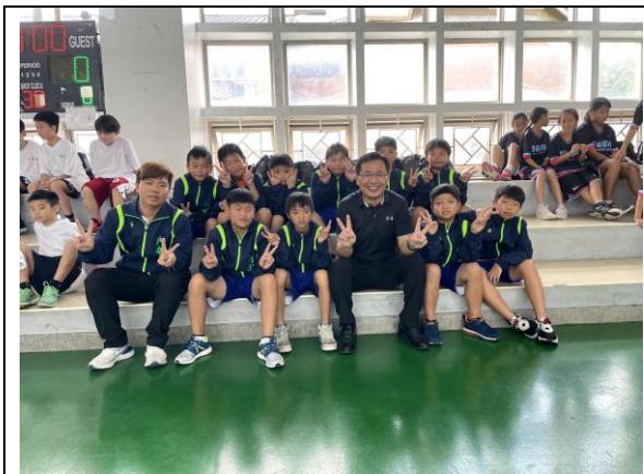
照片說明：參加全市籃球賽