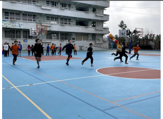
照片說明: 寒假育樂營