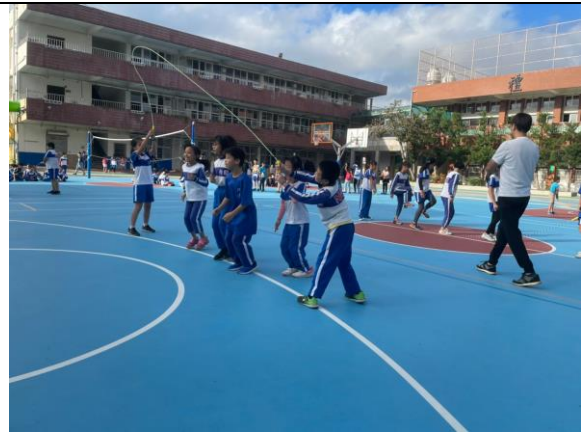
照片說明：考後運動-四年級