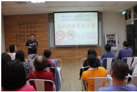
說明：家長會日進行宣導