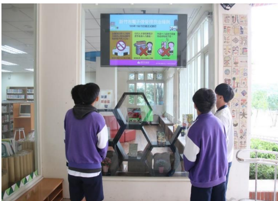
說明：圖書館前電視牆宣導