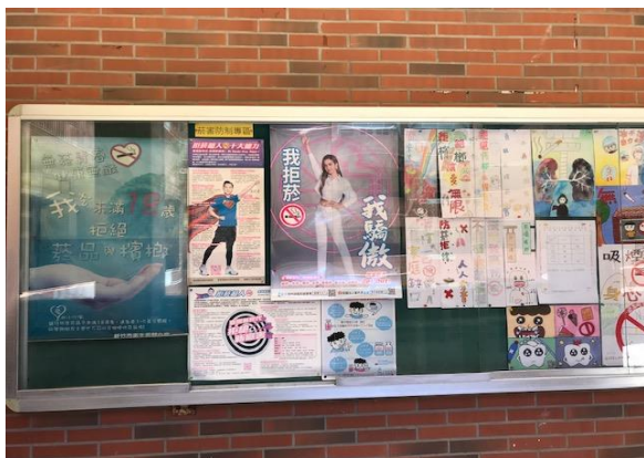
說明：公佈欄宣導-反菸拒檳