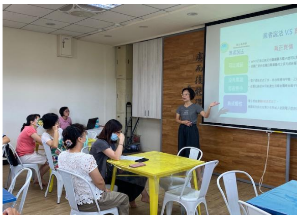
說明：晨會時間教職員電子菸宣導