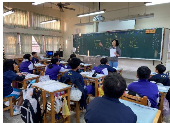
說明：護理師於早自修進班宣導