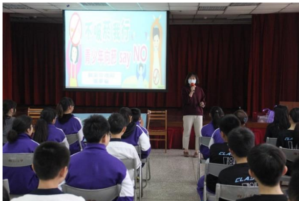
說明：針對學生進行電子菸宣導