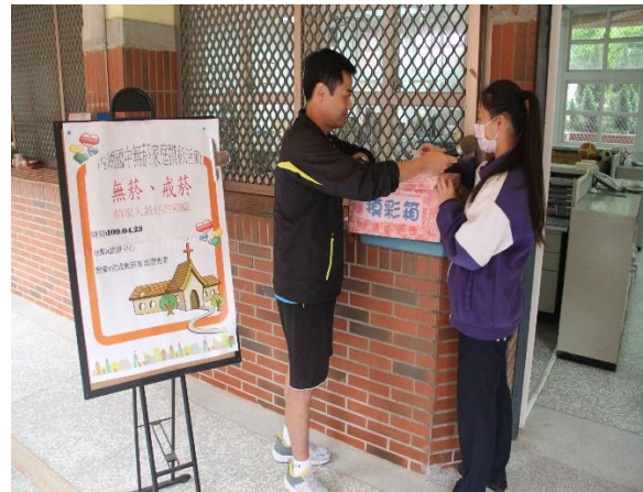
說明：無菸家庭摸彩活動