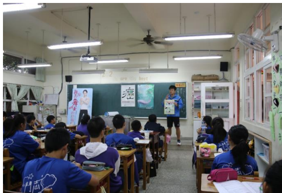
說明：反菸拒檳融入健教課程