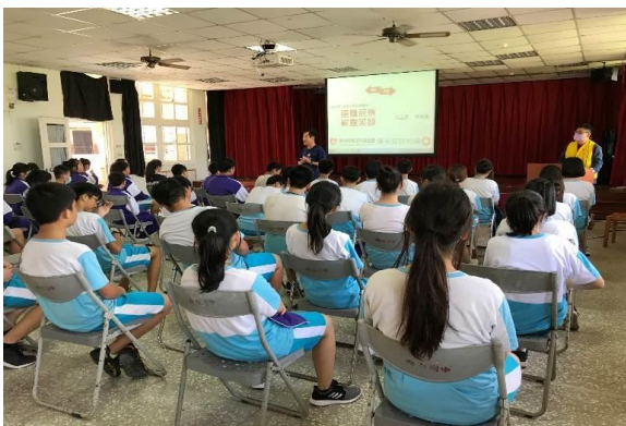
說明：反菸拒檳宣導(陽光基金會)