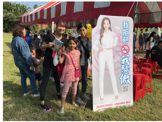
說明：校慶與社區民眾互動