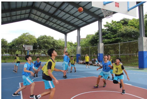
說明：反菸拒檳戶外活動