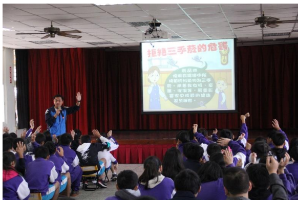
說明：集會反菸拒檳宣導