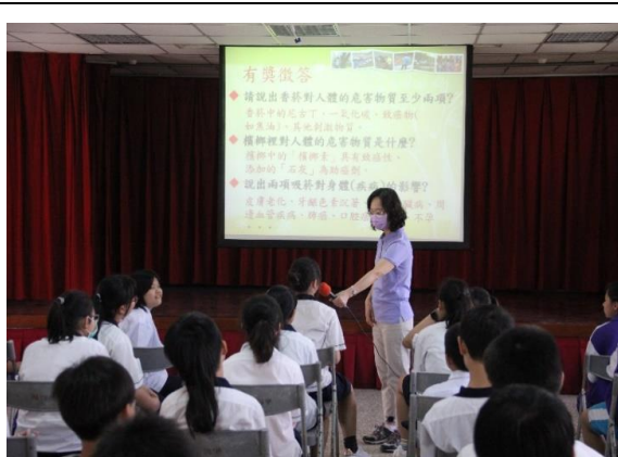
說明：護理師進行反菸拒檳宣導