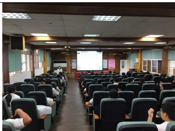
各校反菸拒檳電子煙宣導