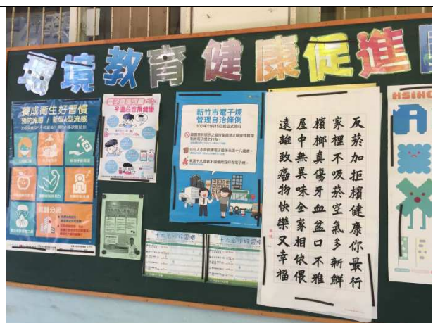
布告欄，張貼海報，公告最新消息，加強宣導。