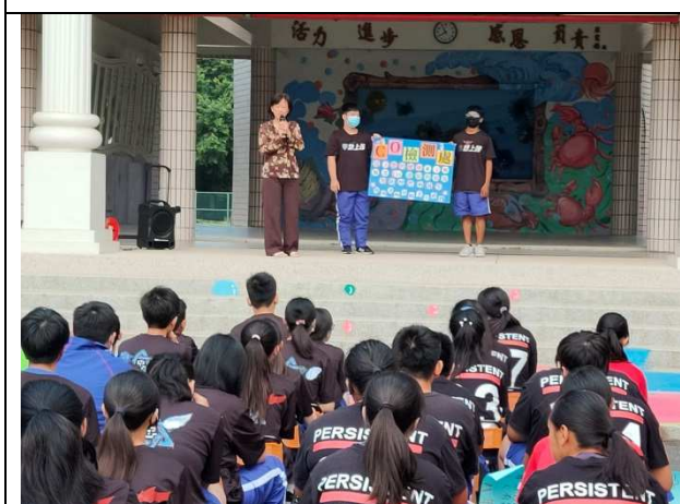
各校反菸拒檳宣導