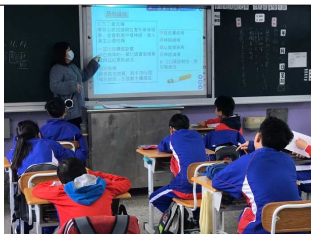
宣導反菸拒檳拒絕技巧融入課程