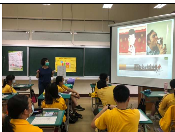
各校反菸拒檳宣導