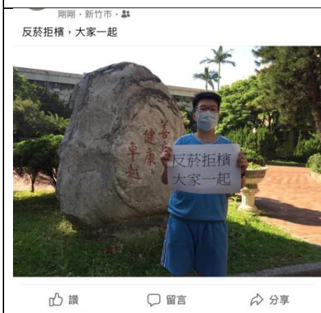
反菸拒檳標語打卡活動，藉由FB打卡上傳照片，宣示自己的理念，達到最大的宣傳效果。(109.3)