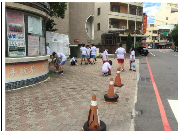
訓練反菸拒檳學生大使，利用時間在街上進行宣導遊行，並撿拾菸蒂垃圾。