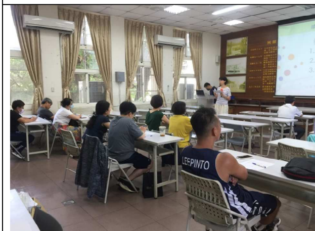
辦理新竹市菸、檳危害防制校群第三次共識會議(109.6.18)