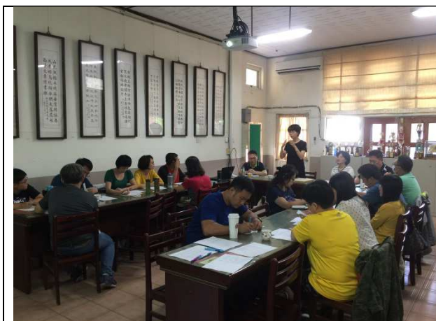
辦理新竹市菸、檳危害防制校群第一次共識會議(108.9.24)