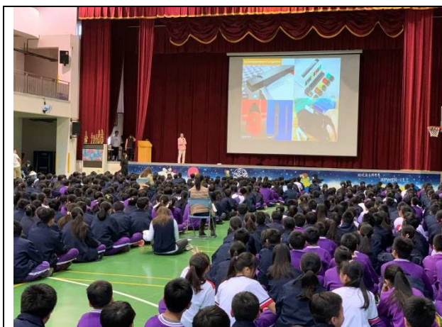
各校反菸拒檳電子煙宣導