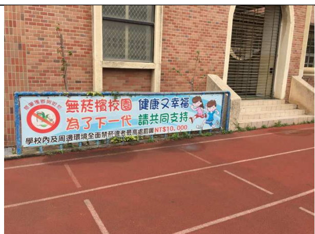
操場設置無菸檳布條，讓家長及社區一起參與以實際行動禁菸。