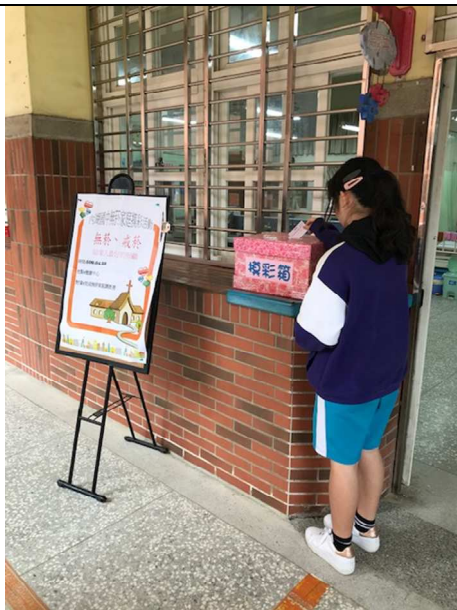
內湖國中無菸家庭活動