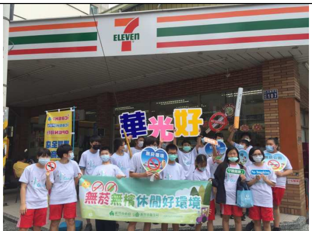
反菸拒檳學生大使，到附近便利商店進行「未滿18歲，不可賣菸給我」宣導。