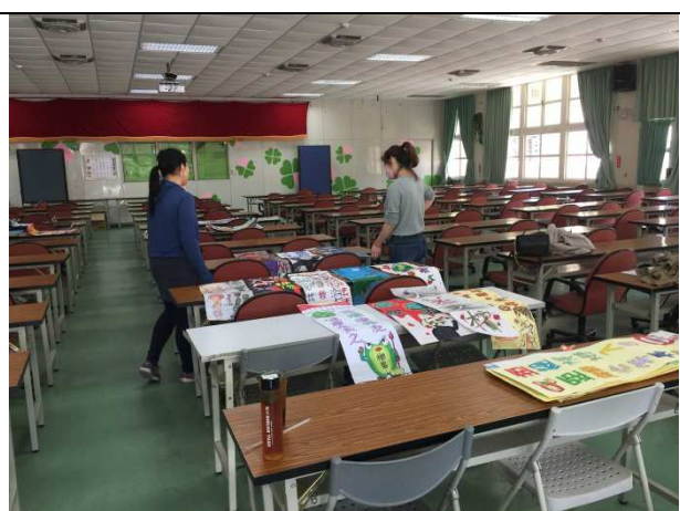
辦理全市反菸海報、戒菸標語競賽，藉由同學們的繪畫，進行宣導。