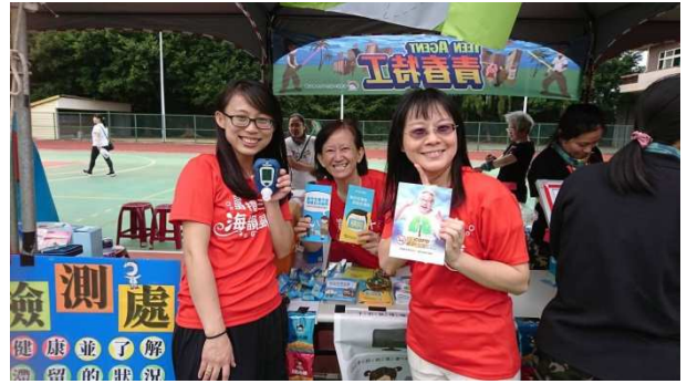
各校反菸拒檳校慶活動