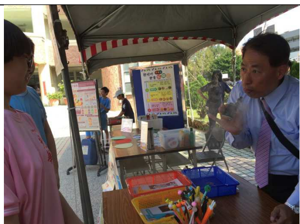
請校外會教官以電子煙實物，讓學生了解電子煙的運作，從中了解可能的危害，與相關的法律知識。