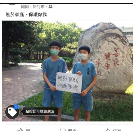
反菸拒檳標語打卡活動，藉由FB打卡上傳照片，宣示自己的理念，達到最大的宣傳效果。(109.3)