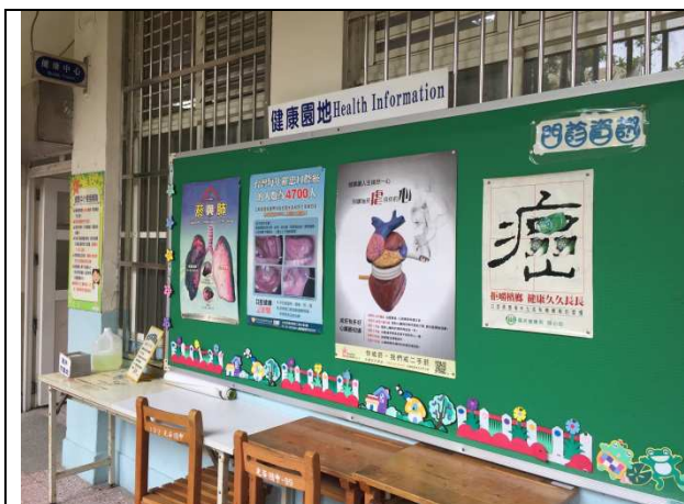
健康中心布告欄，公告健康資訊及菸癮防制、戒菸等資訊。