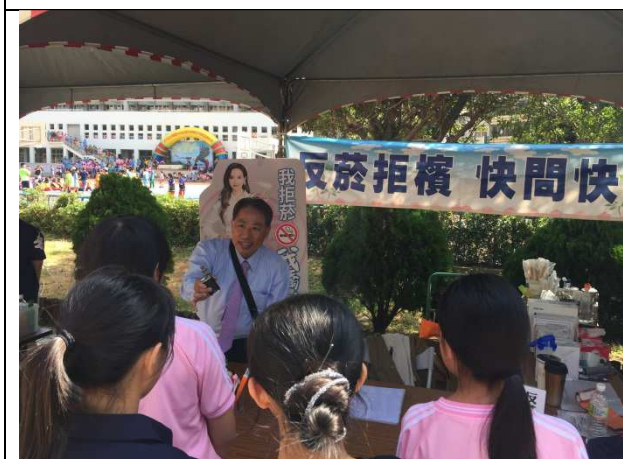
請校外會教官以電子煙實物，讓學生了解電子煙的運作，從中了解可能的危害，與相關的法律知識。