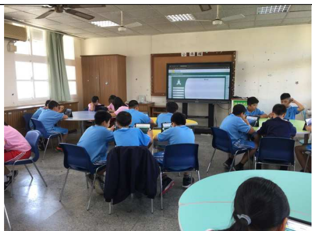
健康促進無菸拒檳議題電腦問卷施測