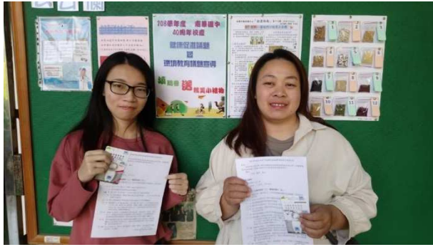
反菸拒檳啦啦隊活動