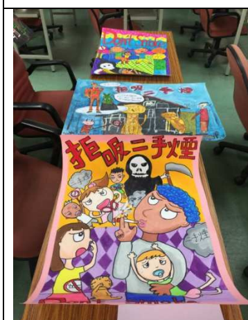
辦理全市反菸海報、戒菸標語競賽，藉由同學們的繪畫，進行宣導。