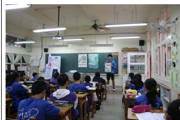
宣導反菸拒檳拒絕技巧融入課程