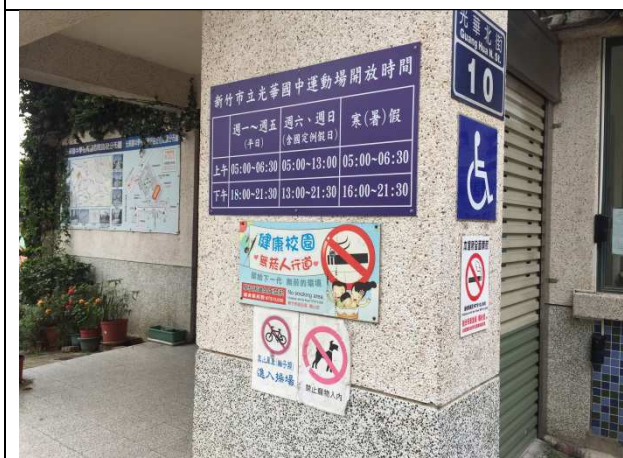
校門口張貼禁菸標示，讓家長及社區一起參與以實際行動禁菸。