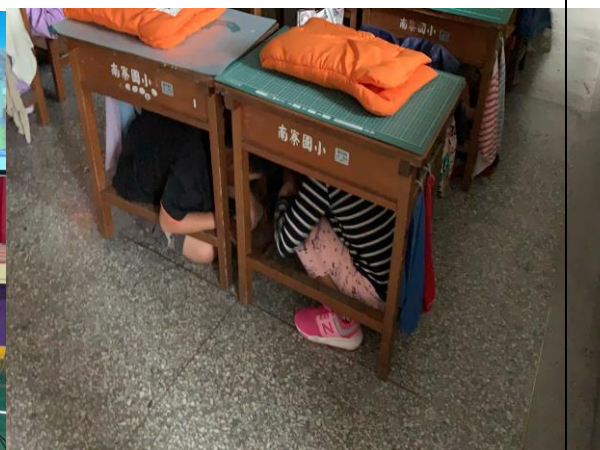
真實地震來臨，避震有一套