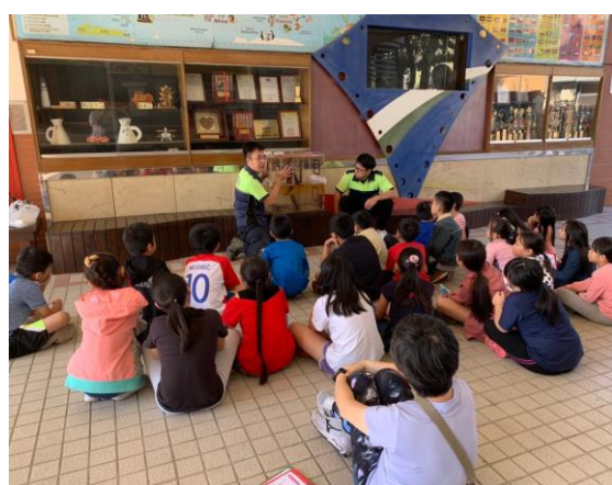
四年級消防護照闖關