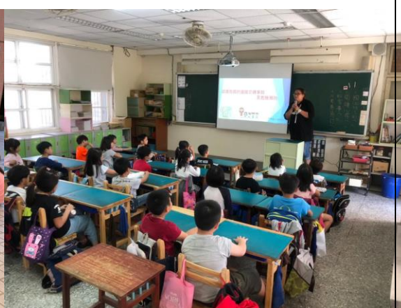
交通安全數據分析講解