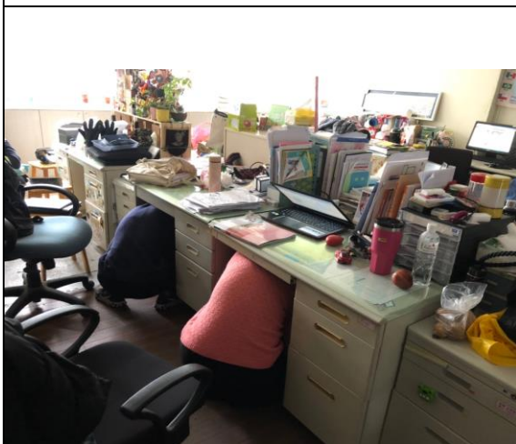
防災演練教職員工演練